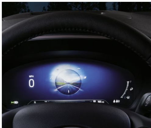
12.3" kolorowy wyświetlacz na tablicy zegarów