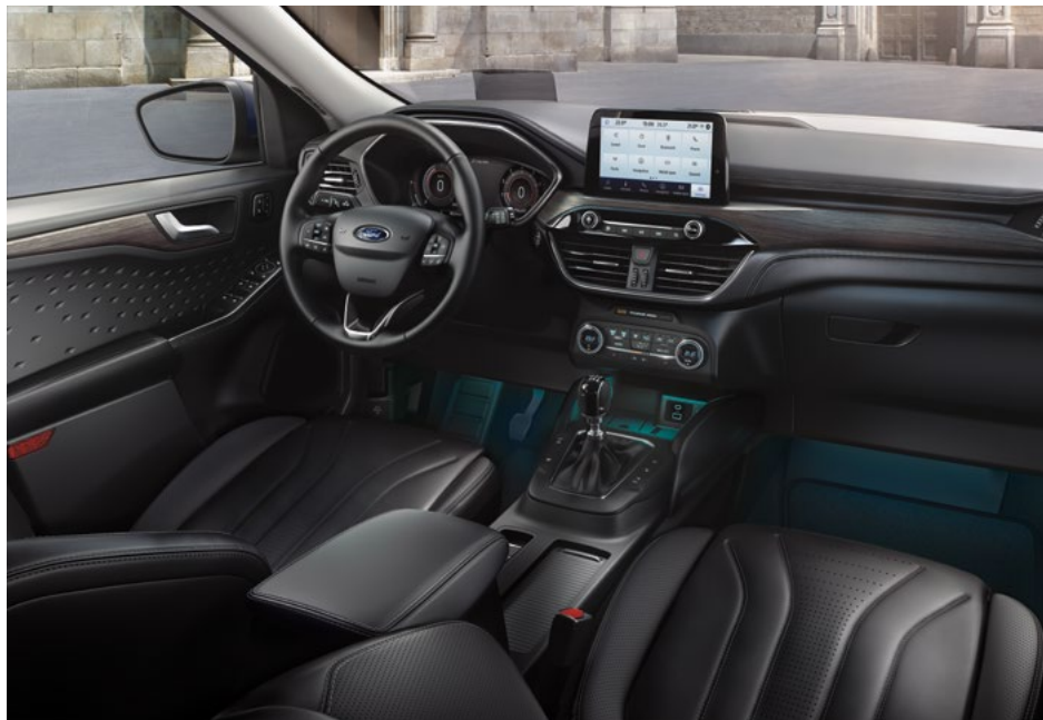
Nowy Ford Kuga Vignale