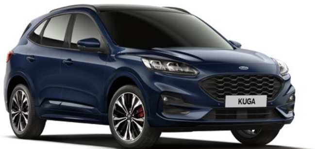
BLAZER BLUE - lakier zwykły bez dopłaty | niedostępny dla wersji Vignale