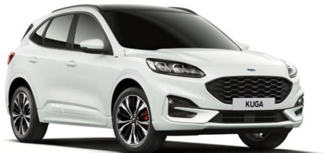
FROZEN WHITE - lakier zwykły 1 050,- | niedostępny dla wersji Vignale