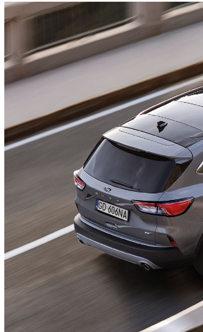
Nowy Ford Kuga Titanium w kolorze Solar Silver (opcja) oraz 18" obręczami kół ze stopów lekkich (opcja)

Sprawdź też ofertę Nowego Forda Kuga PLUG-IN HYBRID oraz Hybrid, dostępną w osobnym cenniku.