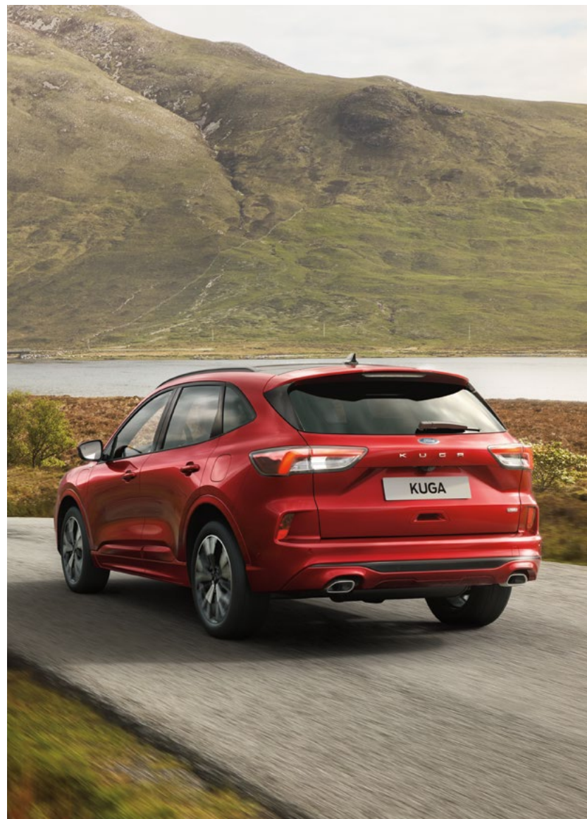
Nowy Ford Kuga ST-Line w kolorze Lucid Red (opcja)