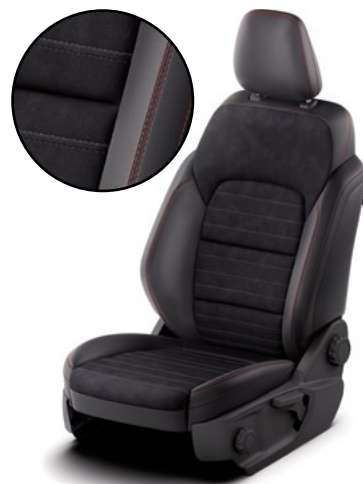
RAPTON / SENSICO - tapicerka częściowo skórzana (skóra ekologiczna) z czerwonymi akcentami