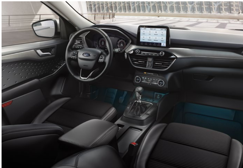
Nowy Ford Kuga Titanium