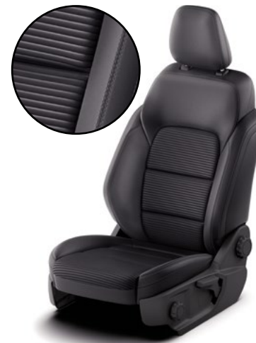
CUIR / SENSICO - tapicerka częściowo skórzana (skóra ekologiczna)