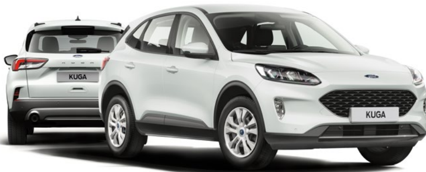
Nowy Ford Kuga Trend w kolorze Frozen White (opcja)