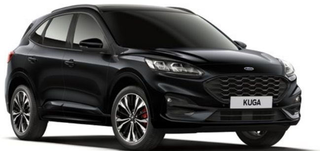
AGATE BLACK - lakier metalizowany 2 200,- | bez dopłaty dla wersji Vignale