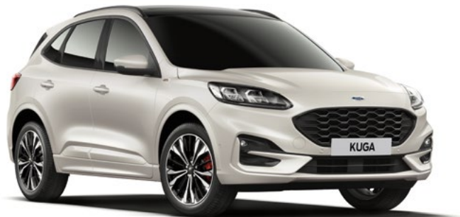
WHITE PLATNUM - lakier metalizowany specjalny 3 600,- | 1 400,- dla wersji Vignale | lakier niedostępny dla wersji Trend