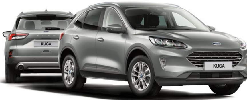
Nowy Ford Kuga Titanium w kolorze Solar Silver (opcja)