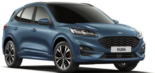
CHROME BLUE - lakier metalizowany 2 200,- | niedostępny dla wersji Vignale