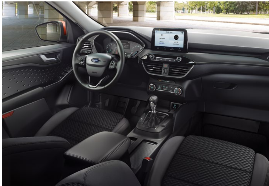
Nowy Ford Kuga Trend