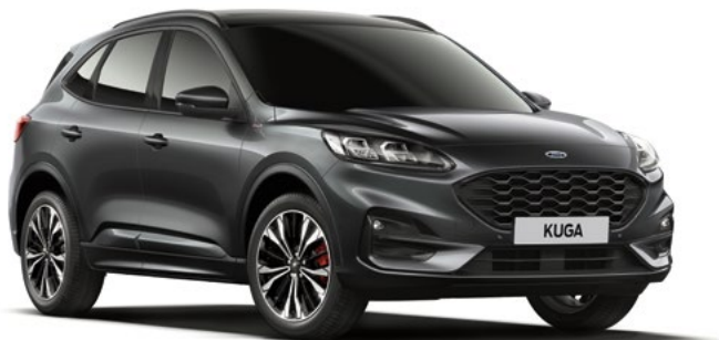
MAGNETIC GREY - lakier metalizowany 3 000,- | 800,- dla wersji Vignale