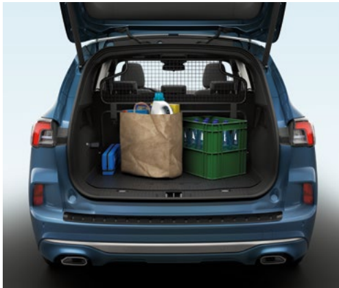
Drzwi bagażnika zamykane i otwierane elektrycznie i bezdotykowo