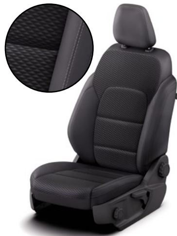
ZAHA - tapicerka materiałowa