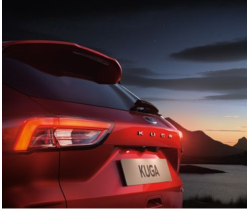
Duży, tylny spoiler lakierowany w kolorze nadwozia