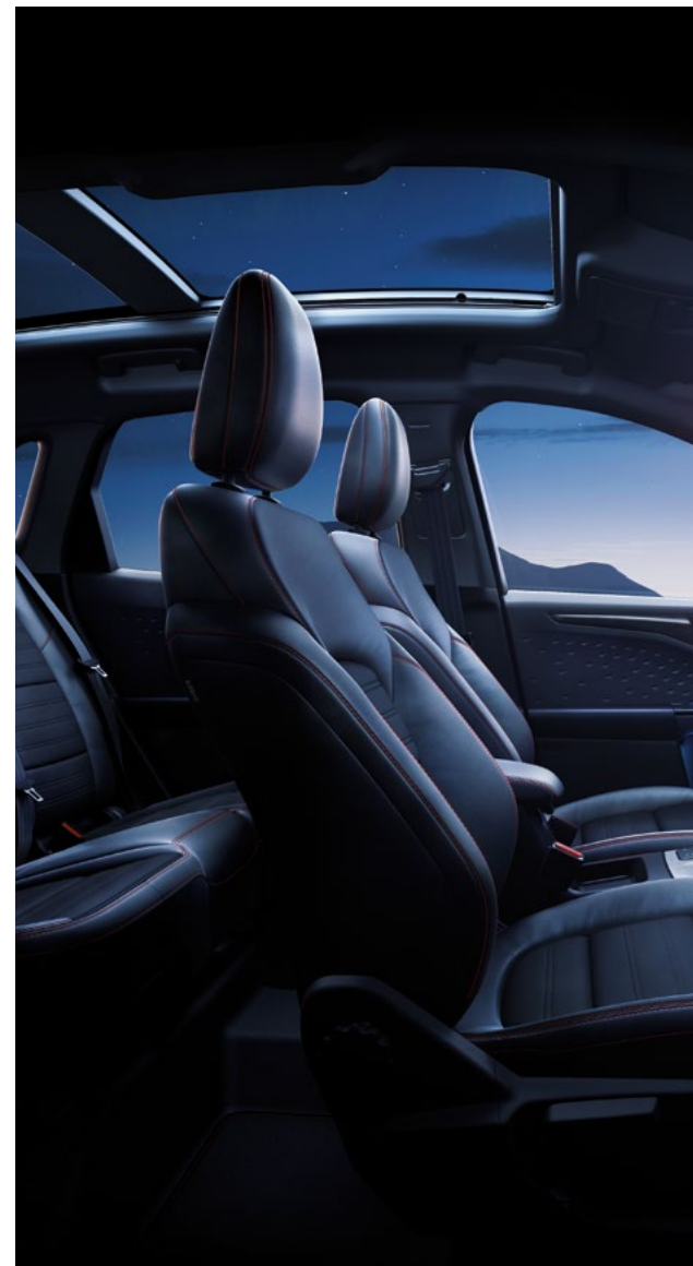
Nowy Ford Kuga ST-Line z pakietem X oraz opcjonalnym wyposażeniem