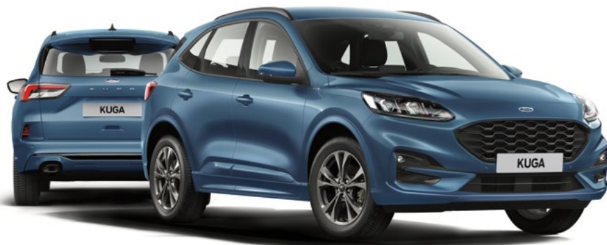
Nowy Ford Kuga ST-Line w kolorze Chrome Blue (opcja)