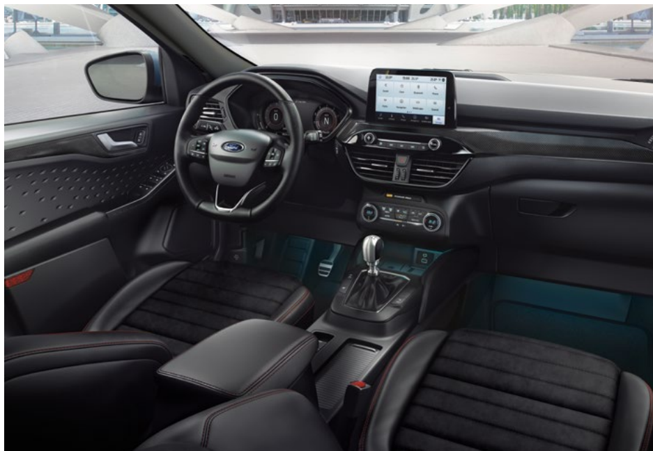
Nowy Ford Kuga ST-Line