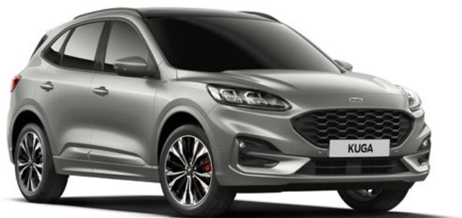
SOLAR SILVER - lakier metalizowany 2 200,- | bez dopłaty dla wersji Vignale