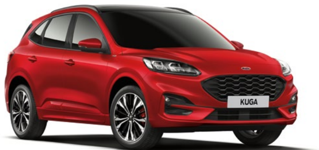
LUCID RED - lakier metalizowany specjalny 3 600,- | 1 400,- dla wersji Vignale