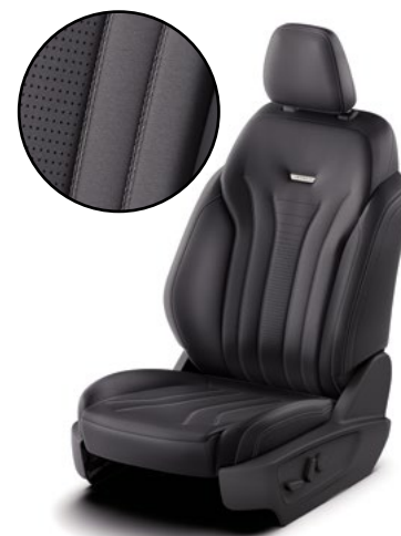
WINDSOR - tapicerka skórzana