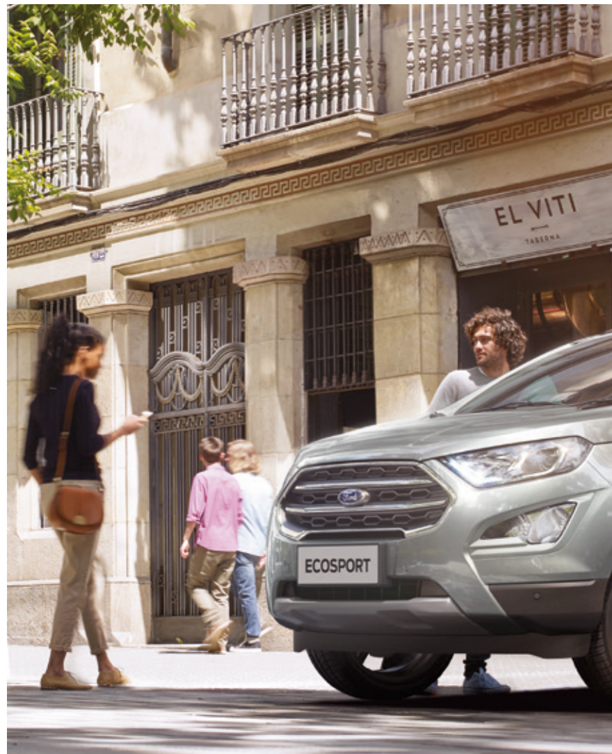
FORD ECOSPORT TITANIUM W KOLORZE MAGNETIC GREY (OPCJA)