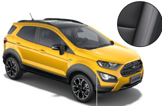
LAKIER METALIZOWANY LUXE YELLOW (OPCJA)