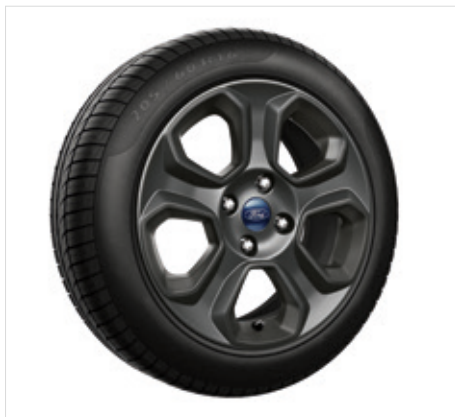
KOMPLET 16" KÓŁ ZIMOWYCH Z FELGAMI ZE STOPÓW LEKKICH OPONY SEMPERIT 205/60 R16 92H (2 417 961)