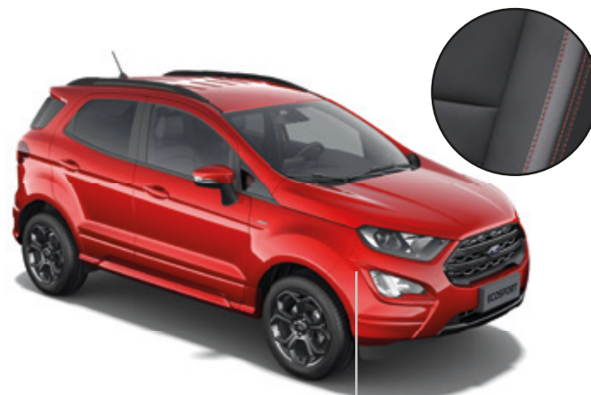
LAKIER METALIZOWANY SPECJALNY FANTASTIC RED (OPCJA)

LEASING Z KORZYSTNĄ RATĄ FORD LEASING OPCJE 2