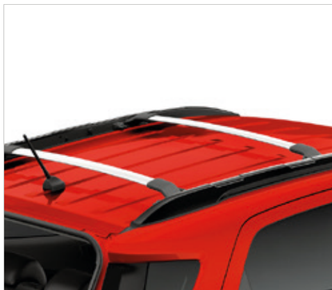
BAGAŻNIK DACHOWY (1 876 580)

WSZYSTKIE WERSJE WYPOSAŻONE W RELINGI | 1 027,-