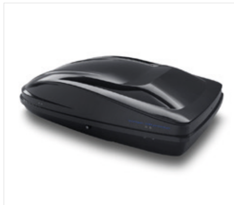
BOX DACHOWY ELEGANCE EUROPE 330 PREMIUM (2 371 147)

WSZYSTKIE WERSJE WYPOSAŻONE W RELINGI | 1 027,-