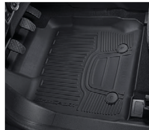
DIWANIKI PODŁOGOWE - PRZÓD, 2 SZT. (2 268 334)

WSZYSTKIE WERSJE WYPOSAŻONE W BAGAŻNIK DACHOWY | 1 304,-