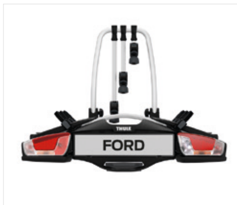
THULE® BAGAŻNIK ROWEROWY, NA 3 ROWERY, SKŁADANY I ODCHYLANY, MOCOWANY NA HAKU (2 353 444)

WSZYSTKIE WERSJE WYPOSAŻONE W HAK HOŁOWNICZY | 2 780,-