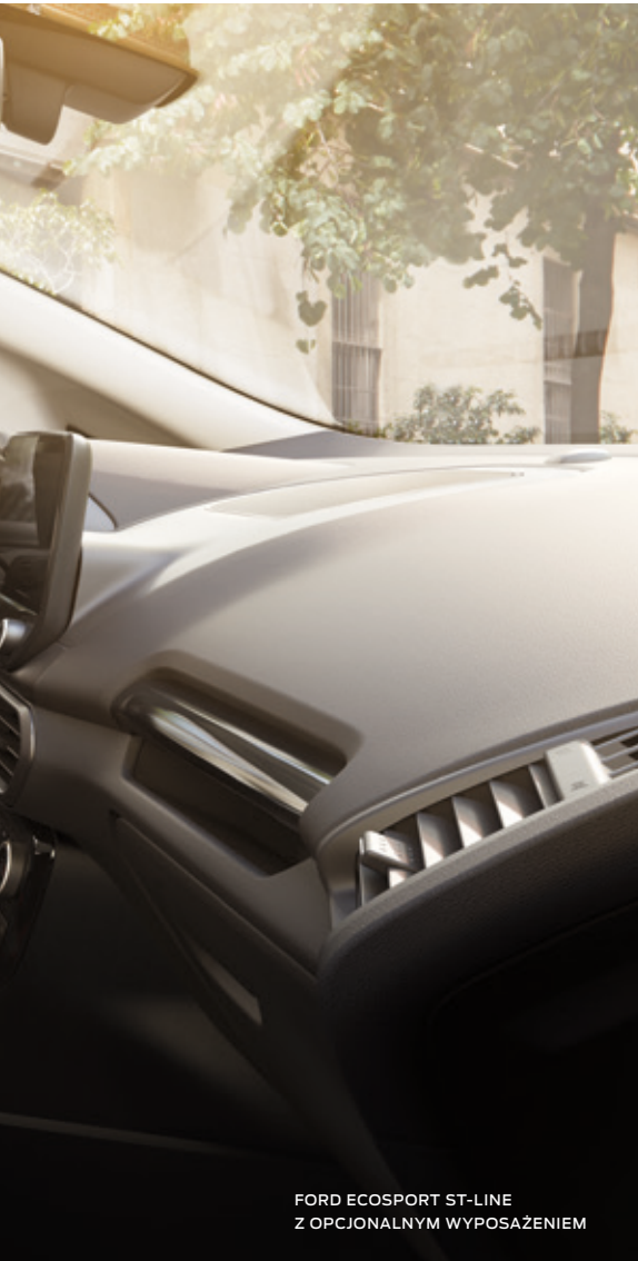
FORD ECOSPORT ST-LINE Z OPCJONALNYM WYPOSAŻENIEM

Wnętrze Forda EcoSport cechuje się wzorową stylistyką, współgrającą z perfekcyjną ergonomią. Najważniejsze funkcje są dostępne pod dedykowanymi przyciskami a ekran dotykowy obsługuje się intuicyjnie. We wnętrzu znajdziemy materiały najwyższej jakości, miękkie i przyjemne w dotyku oraz idealnie spasowane. Dodatkowo każda z wersji wyposażenia wyróżnia się unikalnymi elementami, takimi jak na przykład przeszycia na tapicerce czy kierownicy, podkreślającymi jej unikalny charakter.