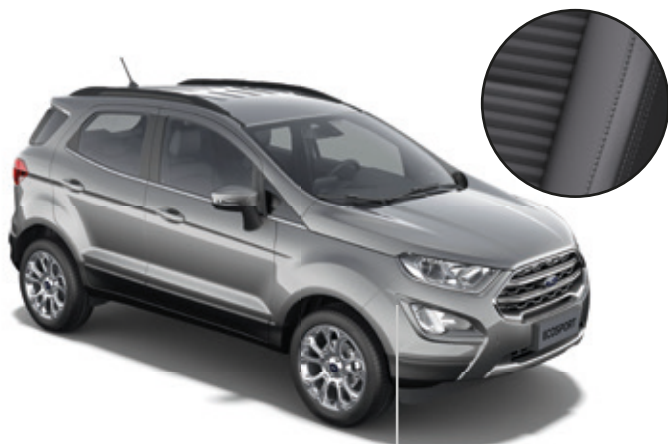
LAKIER METALIZOWANY SOLAR SILVER (OPCJA)