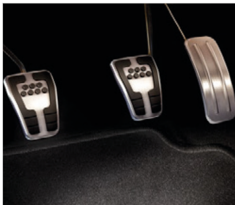
SPORTOWE NAKŁADKI NA PEDAŁY (1 835 213)