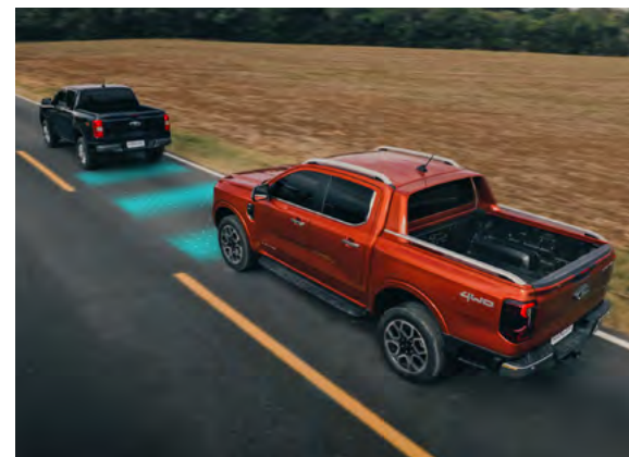
INTELIGENTNY TEMPOMAT ADAPTACYJNY - działający w oparciu o system rozpoznawania znaków drogowych, z systemem Stop&Go oraz Line Centring Standard dla wersji Platinum. Dla pozostałych wersji - Pakiety Technology