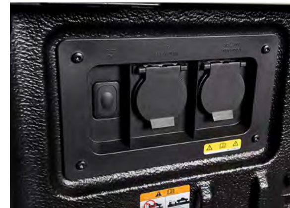
PRZETWORNICA NAPIĘCIA Z GNIAZDAMI 230V

Standard dla wersji Platinum Dla pozostałych wersji opcja dostępna tylko w Pakietach marketingowych