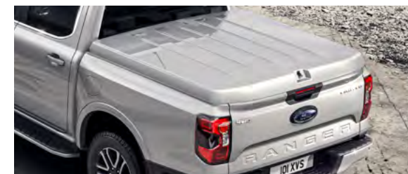
TWARDA POKRYWA SKRZYNI ŁADUNKOWEJ - 1. CZĘŚCIOWA 7 400,- dla wersji Limited