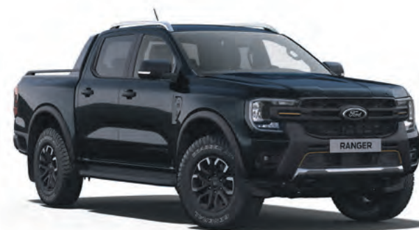
AGATE BLACK - LAKIER METALIZOWANY 3 200,-