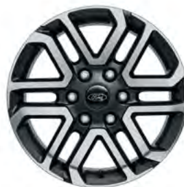
18" OBRĘCZE KÓŁ ZE STOPÓW LEKKICH Standard dla wersji Limited