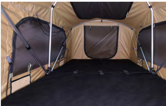
NAMIOT DACHOWY FLINDERS - Z DRABINKĄ 9 668,-