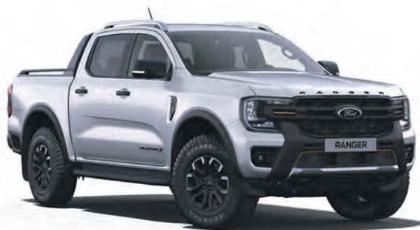
ICONIC SILVER - LAKIER SPECJALNY 3 200,-