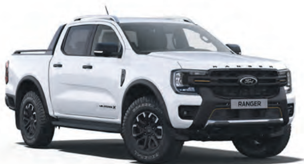
FROZEN WHITE - LAKIER ZWYKŁY bez dopłaty