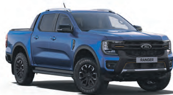
BLUE LIGHTING - LAKIER METALIZOWANY 3 200,- | lakier niedostępny dla wersji XL i Platinum