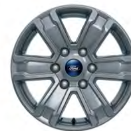
17" OBRĘCZE KÓŁ ZE STOPÓW LEKKICH Dla wersji XLT opcja dostępna w Pakiecie Technology 50