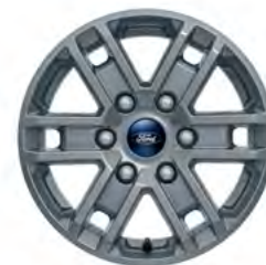
16" OBRĘCZE KÓŁ ZE STOPÓW LEKKICH Standard dla wersji XLT