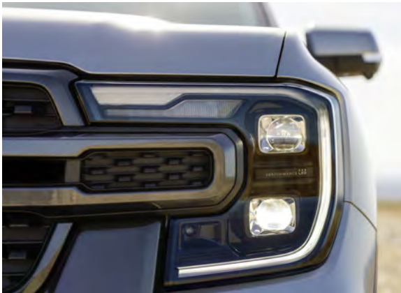
REFLEKTORY PRZEDNIE - ADAPTACYJNE FULL LED Standard dla wersji Platinum Dla wersji Wildtrak X opcja dostępna tylko w Pakiecie Wildtrak X