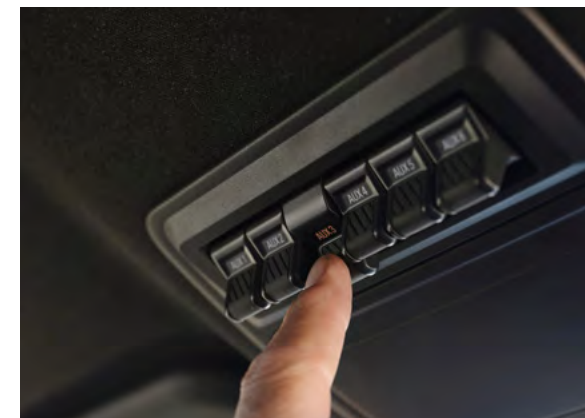
ZESTAW DODATKOWYCH PRZEŁĄCZNIKÓW ZAMONTOWANYCH POD SUFITEM

Standard dla wersji Platinum Dla pozostałych wersji opcja dostępna tylko w Pakietach marketingowych