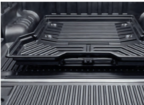
PICKUP ATTITUDE - PRZESUWNA PLATFORMA BAGAŻOWA 6 531,-