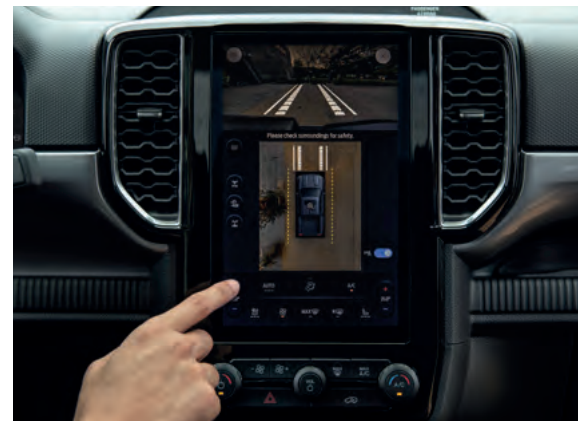
SYSTEM KAMER 360 STOPNI Standard dla wersji Platinum. Dla wersji Limited, Wildtrak i Wildtrak X Opcja dostępna tylko w pakietach Technology