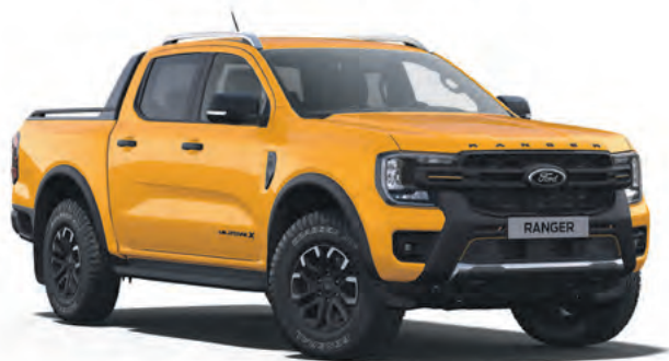
CYBER ORANGE - LAKIER SPECJALNY 3 700,- | lakier dostępny tylko dla wersji Wildtrak i Wildtrak X