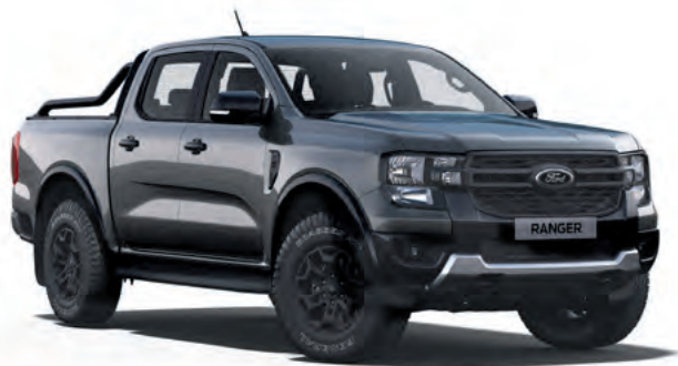
CONQUER GREY - LAKIER PERFORMANCE 3 200,- | lakier dostępny tylko dla wersji Tremor