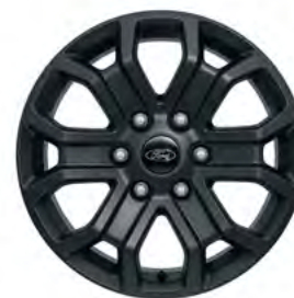
18" OBRĘCZE KÓŁ ZE STOPÓW LEKKICH Opcja dla wersji Wildtrak