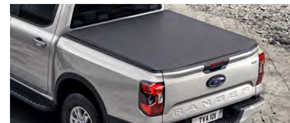
MIĘKKA ROLETA SKRZYNI ŁADUNKOWEJ 2 700,- dla wersji XL, XLT, Tremor, Limited