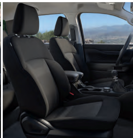
NOWY FORD RANGER W WERSJI XL (PODWÓJNA KABINA) Z LAKIEREM ZWYKŁYM FROZEN WHITE (BEZ DOPLATY)