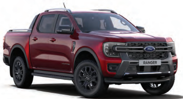
LUCID RED - LAKIER SPECJALNY 3 700,- | lakier niedostępny dla wersji Wildtrak X