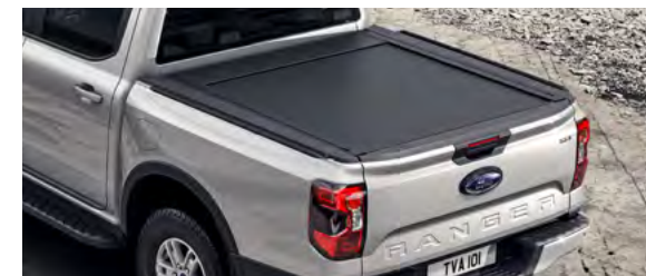
ALUMINIOWA ROLETA SKRZYNI ŁADUNKOWEJ 7 650,- dla wszystkich wersji z wyjątkiem XL