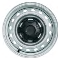
16" STALOWE OBRĘCZE KÓŁ Standard dla wersji XL