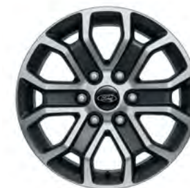
18" OBRĘCZE KÓŁ ZE STOPÓW LEKKICH Opcja dla wersji Limited Standard dla wersji Wildtrak