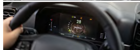
KOLOROWY, KONFIGUROWALNY WYŚWIETLACZ NA TABLICY ZEGARÓW 12.4" - standard dla wersji Platinum (górna grafika) 8" - standard dla pozostałych wersji (dolna grafika)