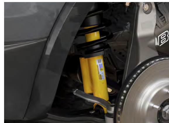
ZAWIESZENIE BILSTEIN - TERENOWE Standard dla wersji Tremor i Wildtrak X