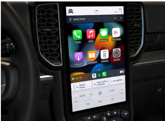
SYSTEM MULTIMEDIALNY FORD SYNC 4A Z BEZPRZEWODOWĄ OBSŁUGĄ APPLE CARPLAY I ANDROID AUTO Standard