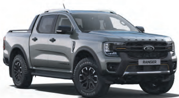
CARBONIZED GREY - LAKIER METALIZOWANY 3 200,-