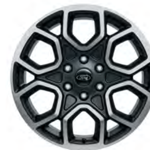
20" OBRĘCZE KÓŁ ZE STOPÓW LEKKICH Opcja dla wersji Wildtrak