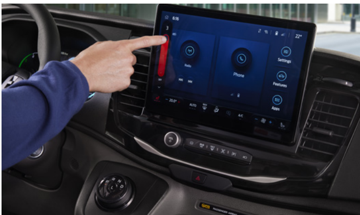
SYSTEM NAWIGACJI SATELITARNEJ Z SYSTEMEM SYNC 4 Standard dla wszystkich wersji