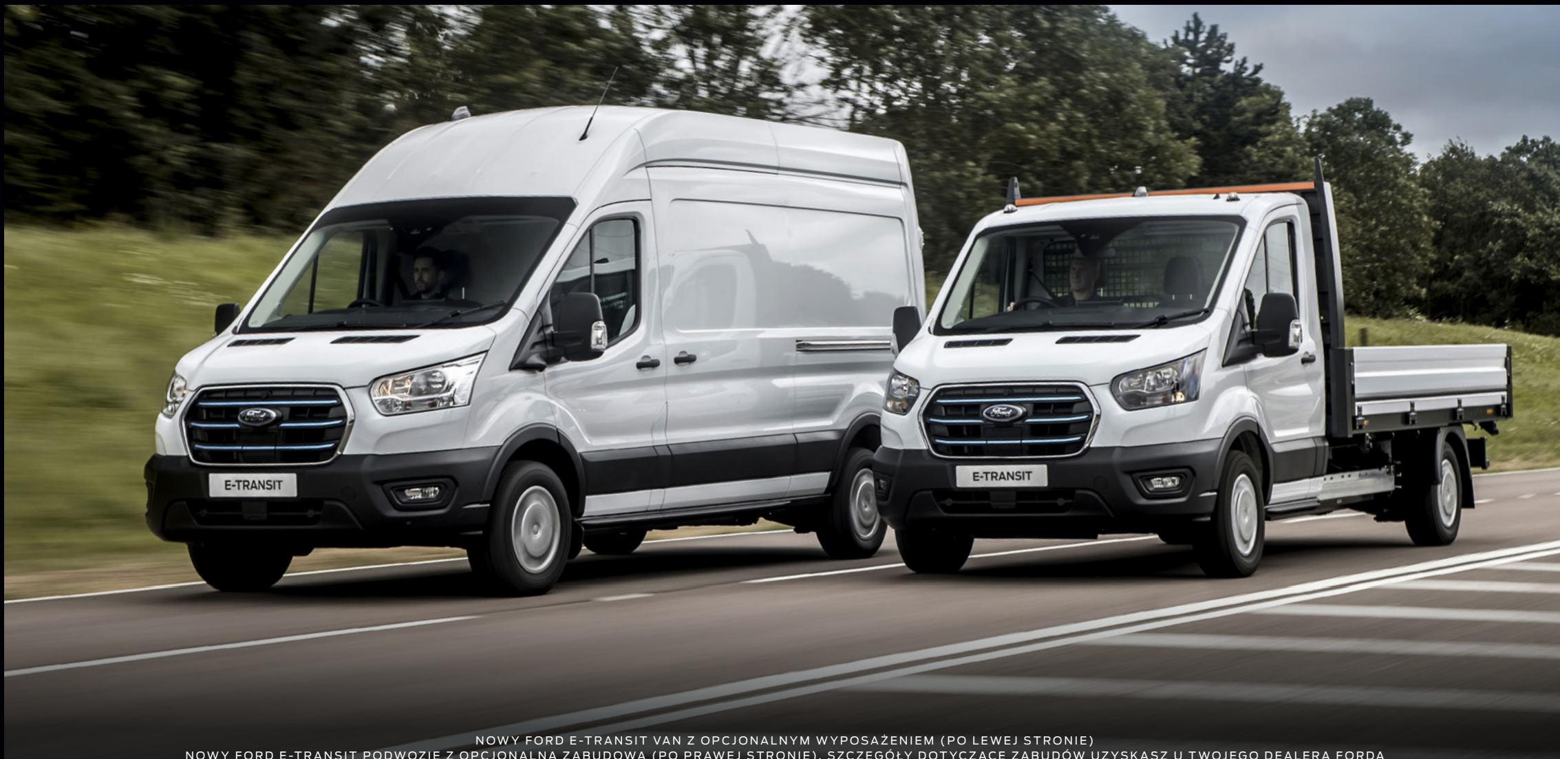
NOWY FORD E-TRANSIT VAN Z OPCJONALNYM WYPOSAŻENIEM (PO LEWEJ STRONIE) NOWY FORD E-TRANSIT PODWOZIE Z OPCJONALNĄ ZABUDOWĄ (PO PRAWEJ STRONIE). SZCZEGÓŁY DOTYCZĄCE ZABUDÓW UZYSKASZ U TWOJEGO DEALERA FORDA