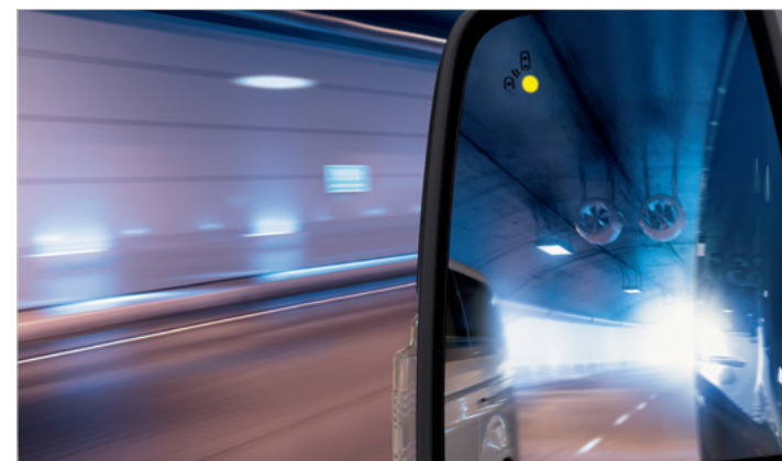
BLIND SPOT INFORMATION (BLIS) Z CROSS TRAFFIC ALERT (CTA)

Opcja dostępna w pakietach Drive Assistance