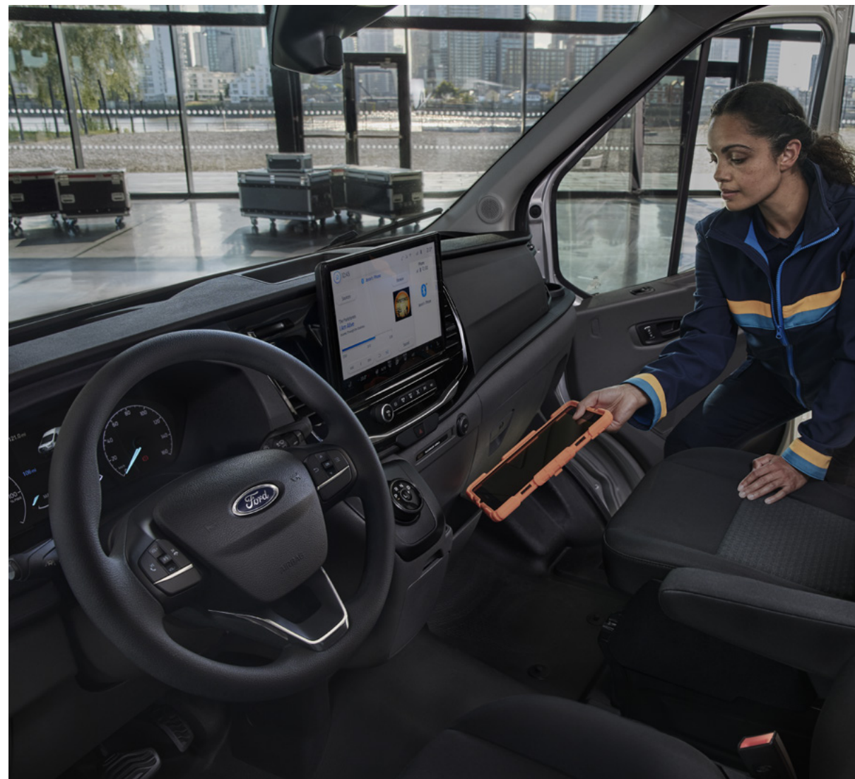
NOWY FORD E-TRANSIT