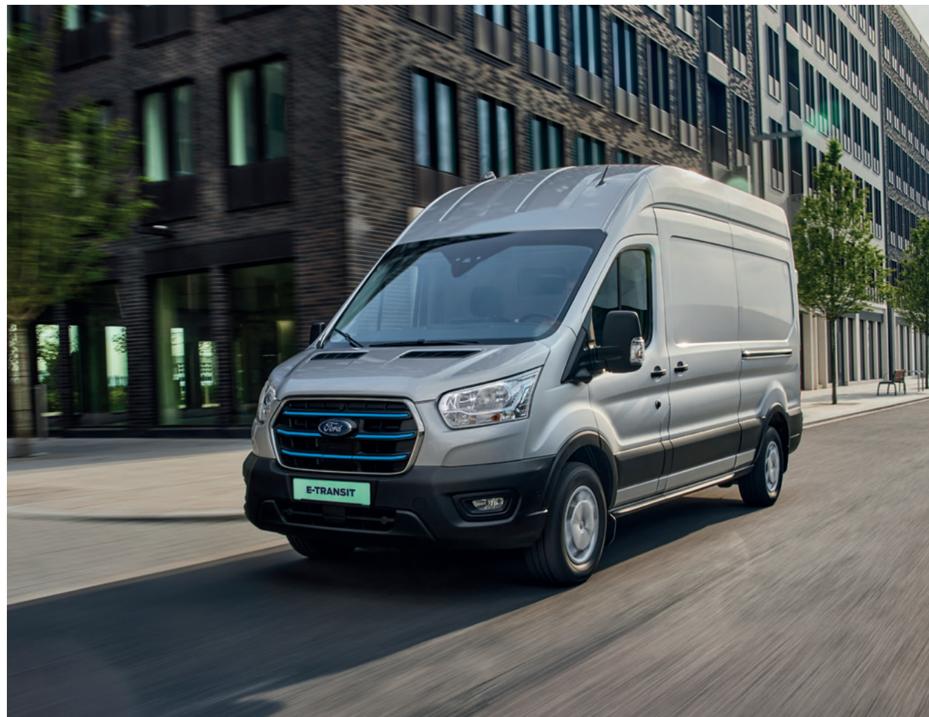
MOONDUST SILVER - LAKIER METALIZOWANY 2 200,-