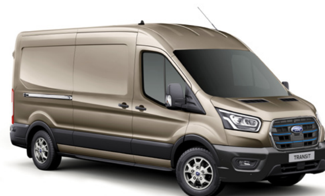
DIFFUSED SILVER - LAKIER METALIZOWANY 2 200,-