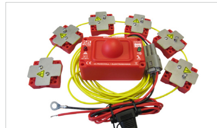
K&K - ODSTRASZACZ KUN M4700 - URZĄDZENIE WIELOFUNKCYJNE (2 033 208) 756 PLN