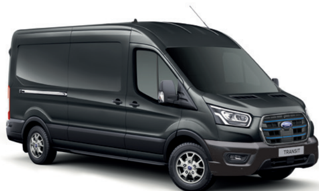
MAGNETIC - LAKIER METALIZOWANY 2 200,-