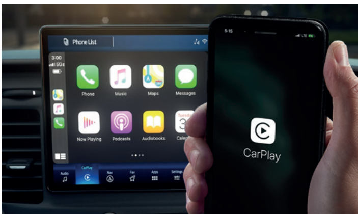
BEZPRZEWODOWA OBSŁUGA APPLE CARPLAY I ANDROID AUTO Standard dla wszystkich wersji. Wymaga kompatybilnego urządzenia.