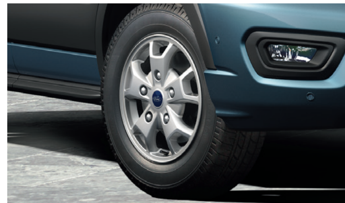
16" OBRĘCZE KÓŁ ZE STOPÓW LEKKICH VAN | BRYGADOWY | PODWOZIE | 2300,-