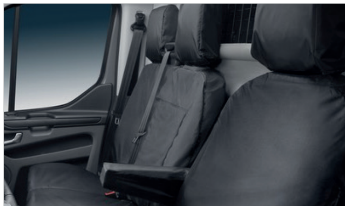
POKROWIEC NA PODWÓJNY FOTEL PASAŻERA, CZARNY (2 326 822) 308 PLN