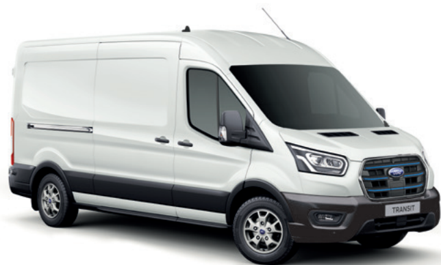
FROZEN WHITE - LAKIER ZWYKŁY bez dopłaty