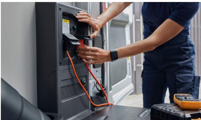
PRO POWER ONBOARD - ZESTAW GNIAZD 230V W KABINIE I W TYLNEJ CZĘŚCI PRZESTRZENI ŁADUNKOWEJ O ŁĄCZNEJ MOCY 2.3 KW VAN | BRYGADOWY | 4 750,-