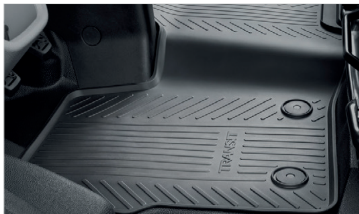
DYWANIKI PODŁOGOWE, GUMOWE - PRZÓD (2 021 104) 215 PLN