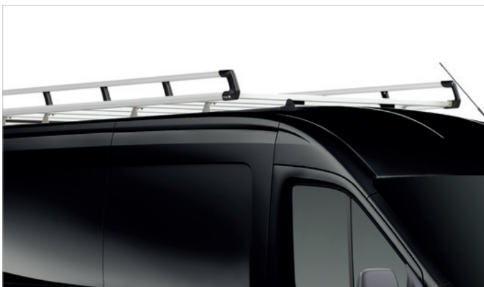
Q-TOP® KOSZ BAGAŻOWY ( 2 485 864) 4 400 PLN