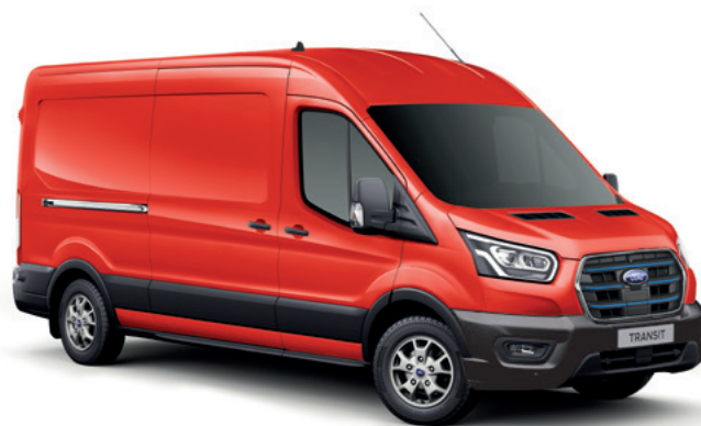
RACE RED - LAKIER ZWYKŁY bez dopłaty