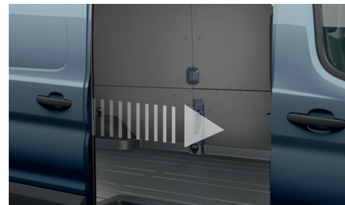
ELEKTRYCZNIE OTWIERANE/ZAMYKANE PRAWY DRZWI BOCZNE, PRZESUWNE VAN | 3 700,-

Opcja dostępna w pakietach Drive Assistance