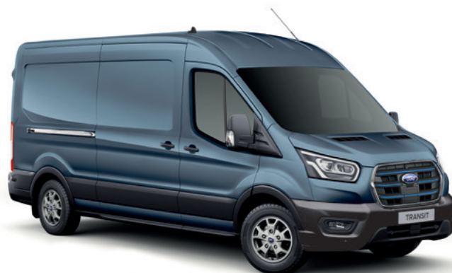
BLUE METALLIC - LAKIER METALIZOWANY 2 200,-