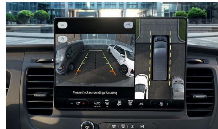
SYSTEM KAMERA 360 STOPNI

Opcja dostępna w pakietach Drive Assistance