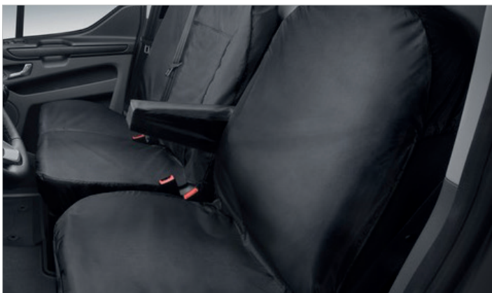
POKROWIEC NA FOTEL KIEROWCY (2 326 838) 197 PLN