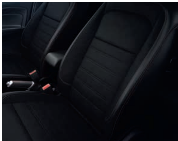
MIKO DINAMICA - tapicerka częściowo skórzana z czerwonymi przeszyciami (5ZBE6)