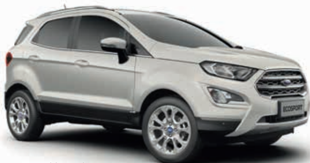
METROPOLIS WHITE - lakier metalizowany 2 250,-