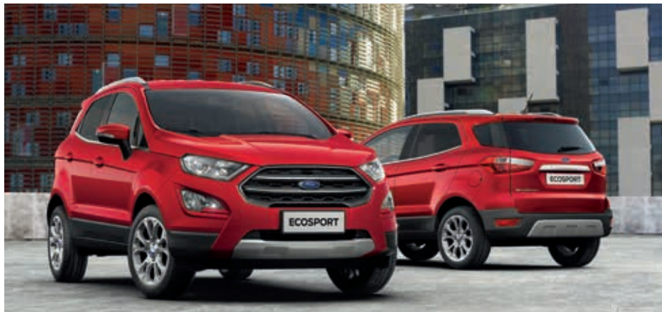
Ford EcoSport Titanium w kolorze Lucid Red (opcja)