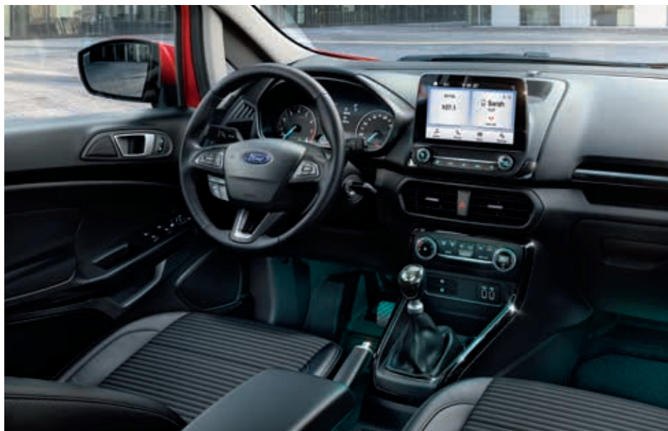
Ford EcoSport Titanium