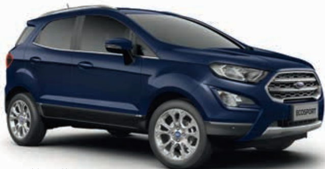
BLAZER BLUE - lakier zwykły bez dopłaty