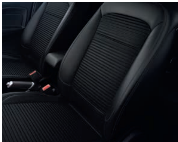
GROOVE - tapicerka częściowo skórzana (3JRE6)