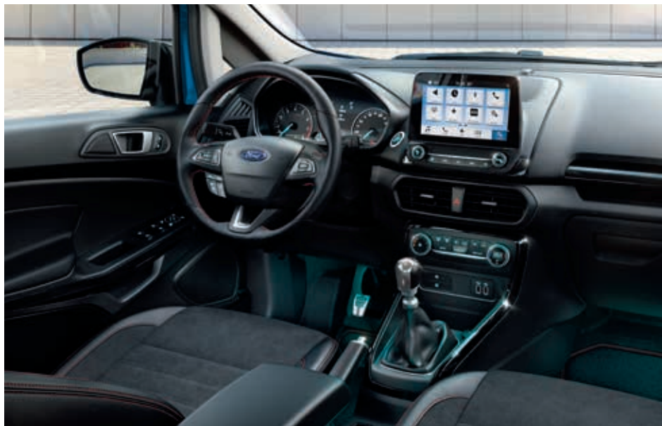
Ford EcoSport ST-Line