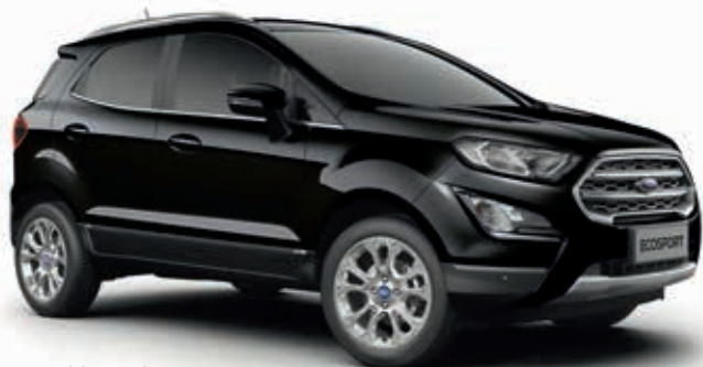
AGATE BLACK - lakier metalizowany 2 250,- | Dla wersji ST-Line lakier dostępny tylko w pakiecie ST-Line Black