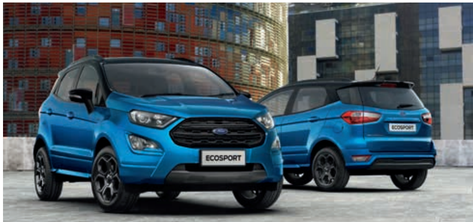
Ford EcoSport ST-Line w kolorze Desert Island Blue (opcja)