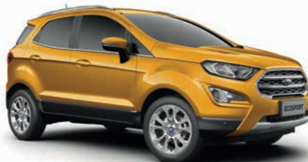
LUXE YELLOW - lakier metalizowany 2 600,-