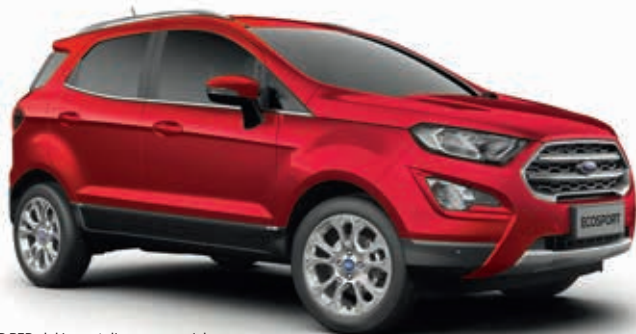
LUCID RED - lakier metalizowany specjalny 2 950,-