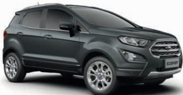
MAGNETIC GREY - lakier metalizowany 2 250,-