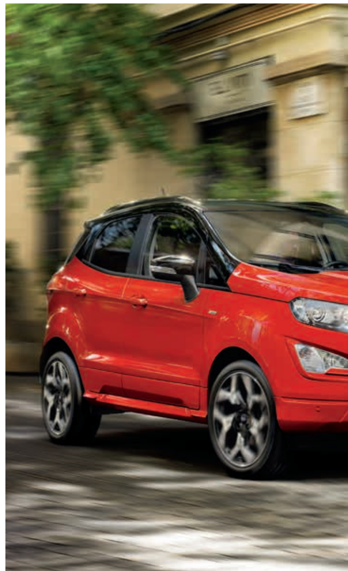
Ford EcoSport ST-Line w kolorze Race Red (opcja) i opcjonalnymi 18" obręczami kół ze stopów lekkich