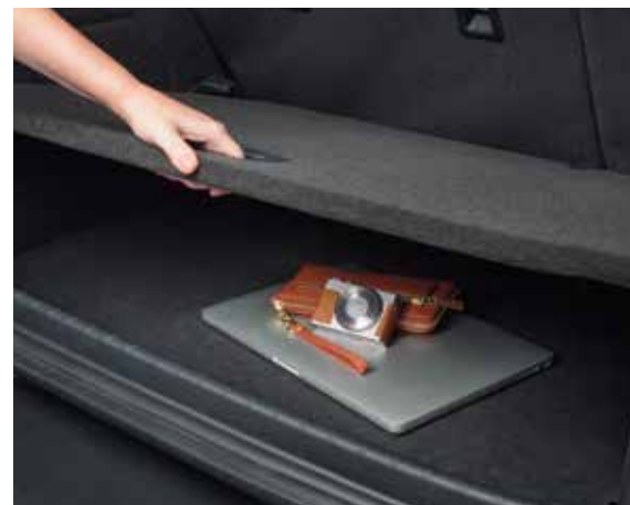
Podwójna podłoga przestrzeni bagażowej