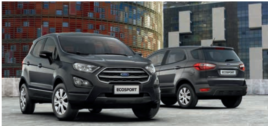
Ford EcoSport Connected w kolorze Magnetic Grey (opcja)