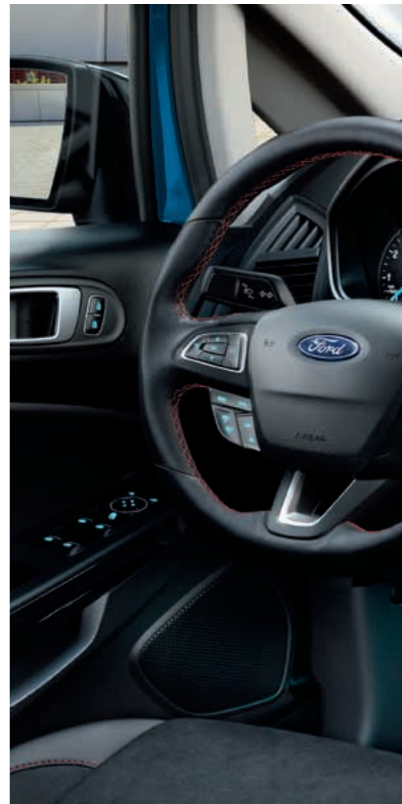
Ford EcoSport ST-Line z systemem nawigacji satelitarnej Ford SYNC 3 (opcja)