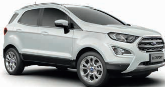
FROZEN WHITE - lakier zwykły 750,-