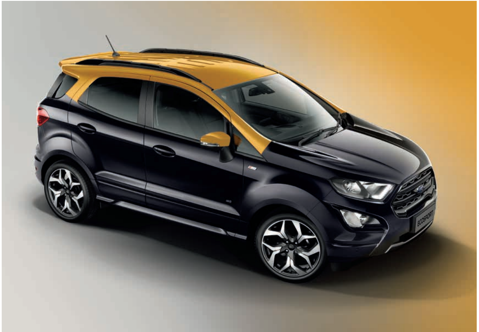
Ford EcoSport ST-Line z pakietem ST-Line Black (bez dopłaty) z opcjonalnymi 18" obręczami ze stopów lekkich