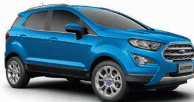
DESERT ISLAND BLUE - lakier metalizowany 2 250,-