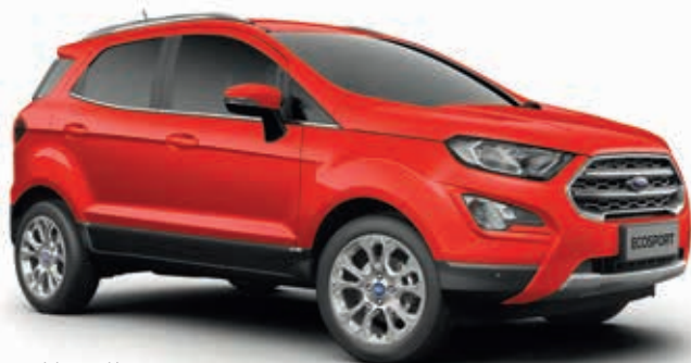
RACE RED - lakier zwykły 750,-