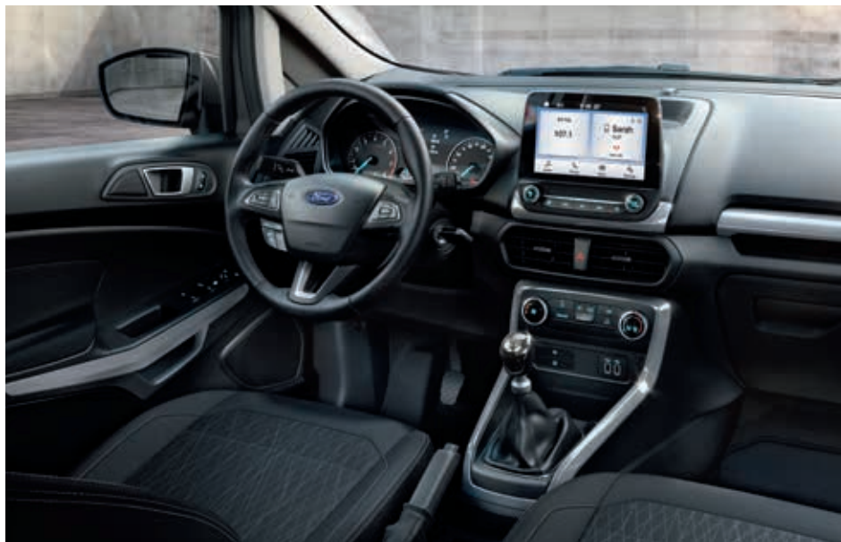
Ford EcoSport Connected