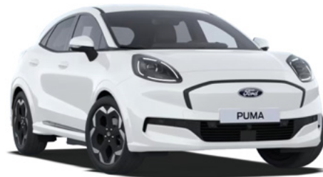
FROZEN WHITE - lakier zwykły 1 000 zł Lakier niedostępny dla wersji BlueCruise