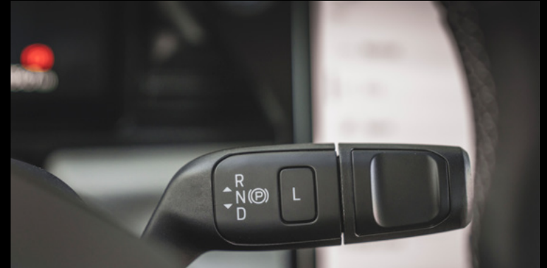
Dźwignia zmiany biegów - przy kierownicy Wyposażenie standardowe wszystkich wersji