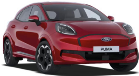
FANTASTIC RED - lakier metalizowany specjalny 3 800 zł Lakier niedostępny dla wersji BlueCruise