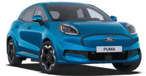
DIGITAL AQUA BLUE - lakier metalizowany specjalny 2 500 zł Lakier niedostępny dla wersji BlueCruise