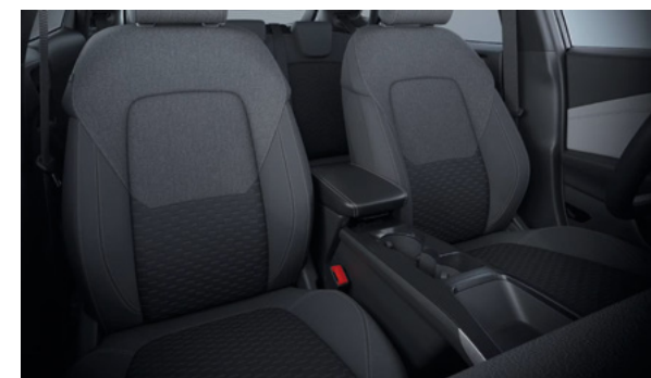
Ford Puma® Gen-E w wersji Puma w kolorze Digital Aqua Blue (wymaga dopłaty) Wnętrze: Tapicerka materiałowa (wyposażenie standardowe)