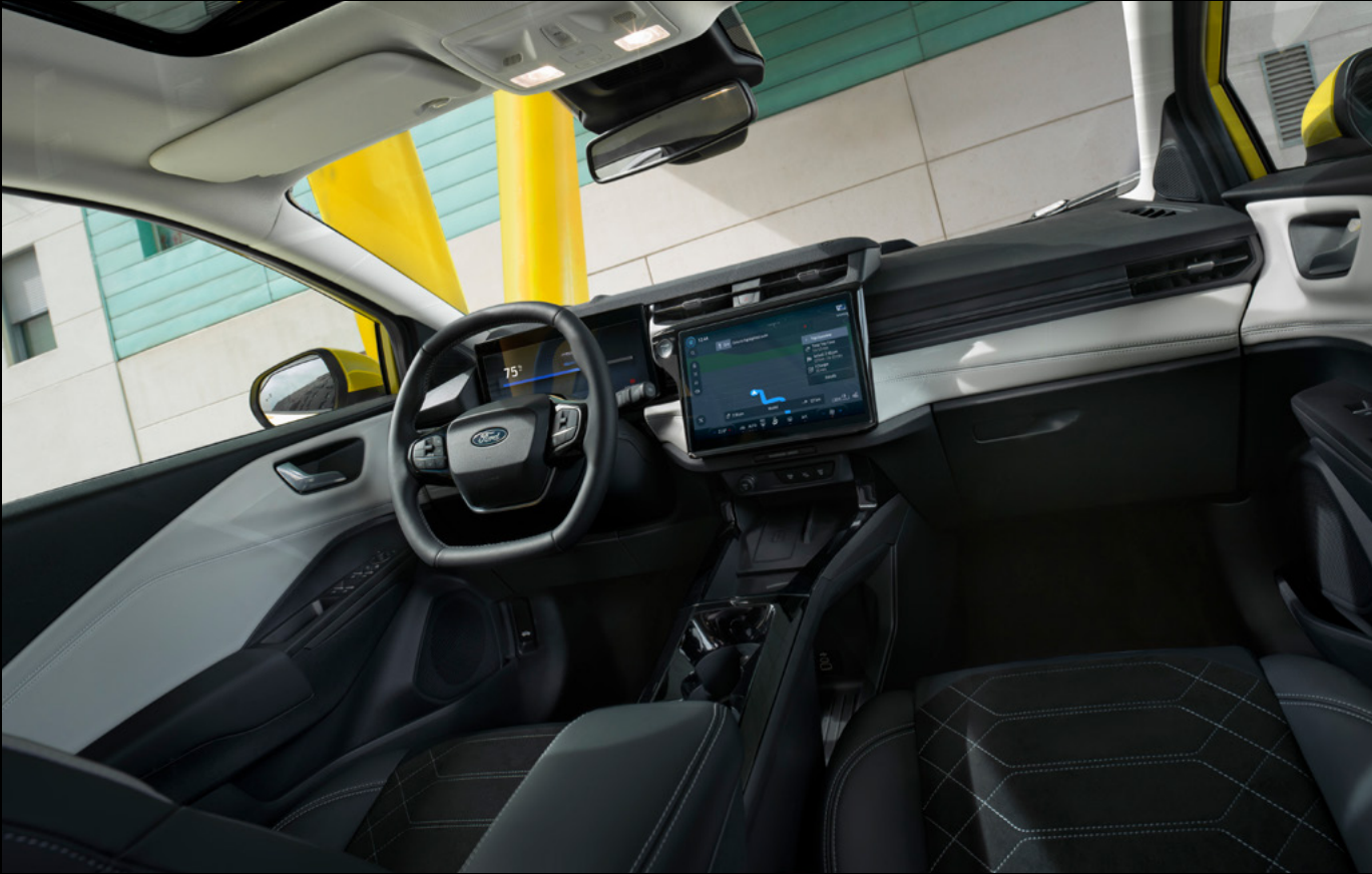
Nowy Ford Puma Gen-E® w wersji Premium z opcjonalnym wyposażeniem

Ciesz się doskonałą jakością dźwięku dzięki systemowi nagłośnienia Premium B&O, który obejmuje wzmacniacz o mocy 650W, 10 głośników (w tym subwoofer) - standard w wersji Premium. Przeniesienie dźwigni zmiany biegów na kierownicę pozwoliło wygospodarować dodatkowy, pojemny schowek pomiędzy fotelami.