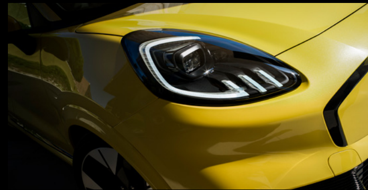
Reflektory Full LED - matrycowe, adaptacyjne Wyposażenie opcjonalne dla wersji Premium i BlueCruise