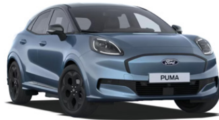
VAPOUR BLUE - lakier metalizowany specjalny Bez dopłaty Lakier dostępny dla wersji BlueCruise