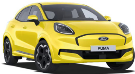
ELECTRIC YELLOW - lakier zwykły bez dopłaty Lakier niedostępny dla wersji BlueCruise