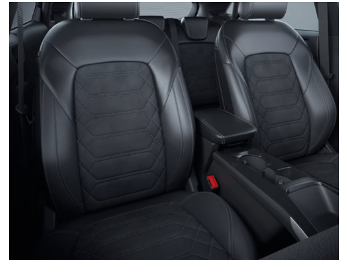
Ford Puma® Gen-E w wersji Premium z pakietem Black