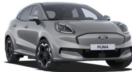
SOLAR SILVER - lakier metalizowany 2 500 zł Bez dopłaty dla wersji BlueCruise