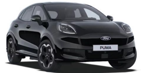
AGATE BLACK - lakier metalizowany 2 500 zł Bez dopłaty dla wersji BlueCruise