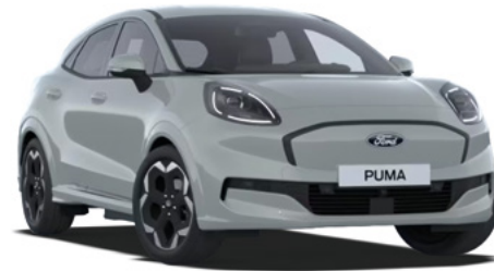
CACTUS GREY - lakier specjalny 2 500 zł Lakier niedostępny dla wersji BlueCruise