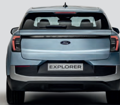
SZEROKOŚĆ CAŁKOWITA Z LUSTERKAMI: 2063 mm