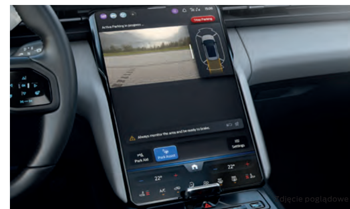
ACTIVE PARK ASSIST - SYSTEM WSPOMAGAJĄCY PARKOWANIE Opcja dostępna tylko w pakiecie Driver Assistance