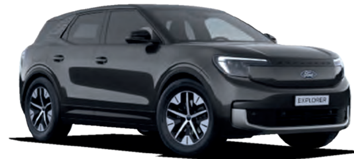
MAGNETIC GREY - LAKIER SPECJALNY 3 000,-