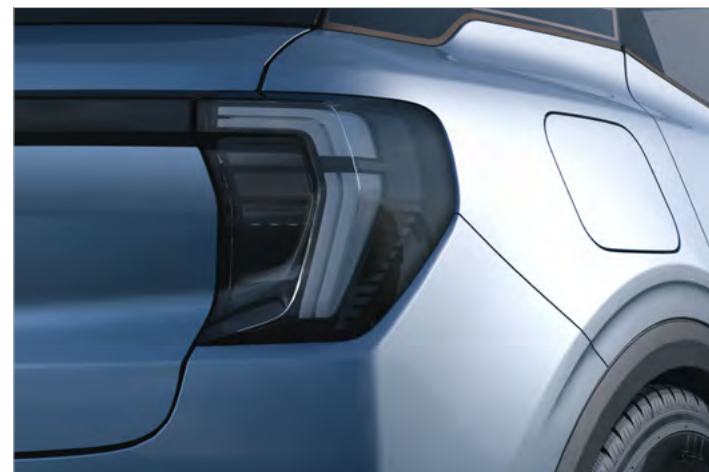
TYLNE ŚWIATŁA W TECHNOLOGII LED Standard dla wersji EXPLORER