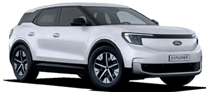
FROZEN WHITE - LAKIER ZWYKŁY 1 500,-