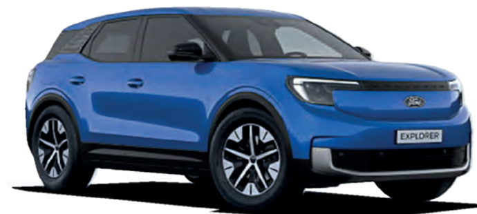
BLUE MY MIND - LAKIER METALIZOWANY SPECJALNY 4 500,-