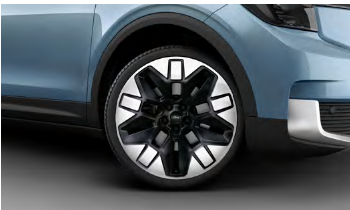
21" OBRĘCZE KÓŁ ZE STOPÓW LEKKICH Opcja dla wszystkich wersji