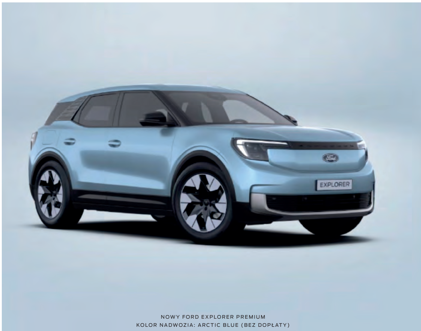
NOWY FORD EXPLORER PREMIUM KOLOR NADWOZIA: ARCTIC BLUE (BEZ DOPŁATY)