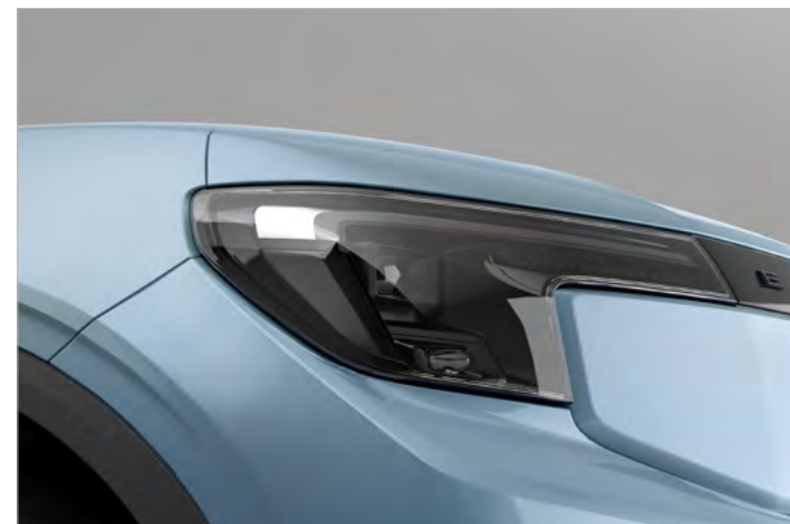
REFLEKTORY MATRYCOWE W TECHNOLOGII LED Standard dla wersji PREMIUM