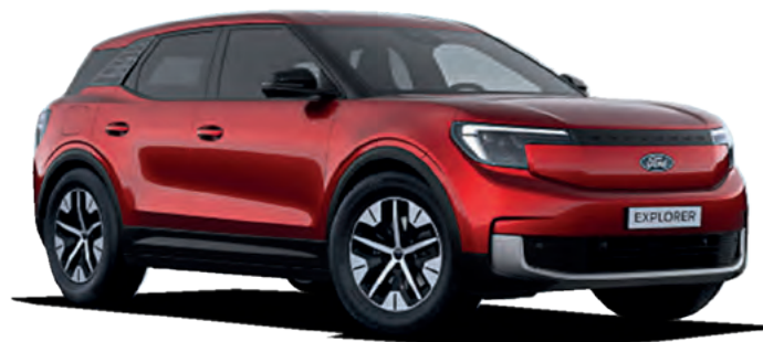
LUCID RED - LAKIER METALIZOWANY SPECJALNY 4 500,-