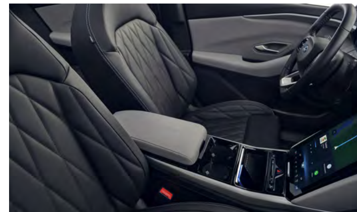
TAPICERKA SKÓRZANA (SKÓRA EKOLOGICZNA SENSICO) Standard PREMIUM