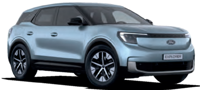
ARCTIC BLUE - LAKIER METALIZOWANY bez dopłaty