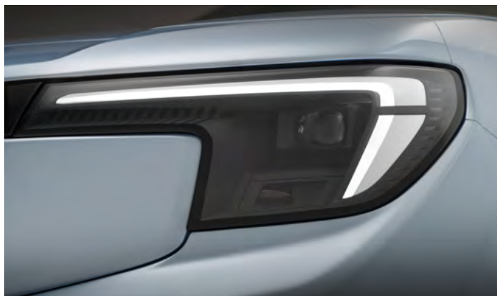
REFLEKTORY MATRYCOWE LED Standard dla wersji Premium