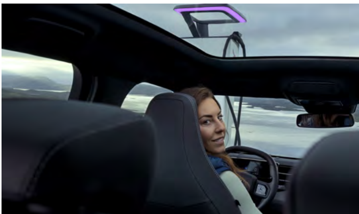
DACH PANORAMICZNY Opcja dla wersji PREMIUM