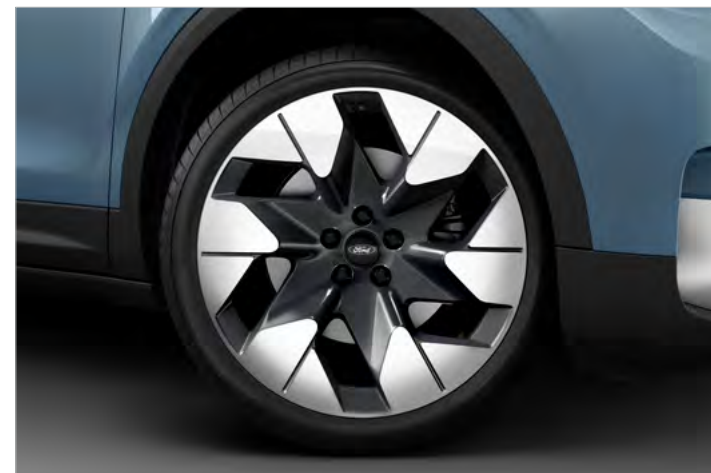
20" OBRĘCZE KÓŁ ZE STOPÓW LEKKICH, OGUMIENIE: PRZÓD 235/50, TYŁ: 255/45 Standard dla wersji PREMIUM