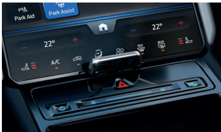
POMPA CIEPŁA Opcja dla wszystkich wersji