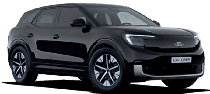
AGATE BLACK - LAKIER METALIZOWANY 3 000,-