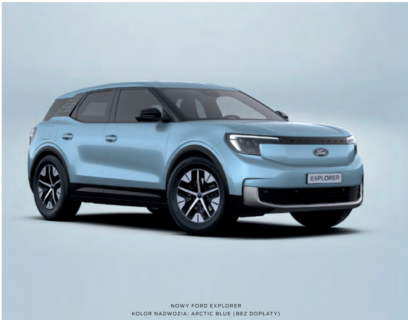
NOWY FORD EXPLORER KOLOR NADWOZIA: ARCTIC BLUE (BEZ DOPŁATY)