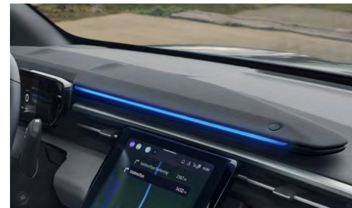
SYSTEM NAGŁOSNIENIA PREMIUM B&O - 10 GŁOŚNIKÓW (W TYM SUBWOOFER) Standard dla wersji Premium