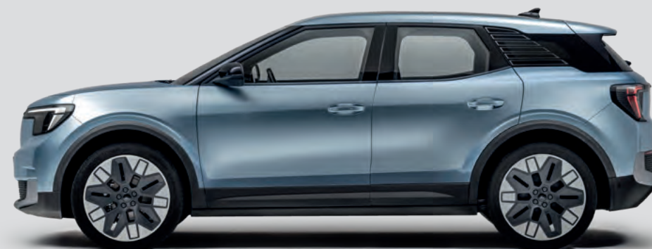
DŁUGOŚĆ CAŁKOWITA: 4468 mm