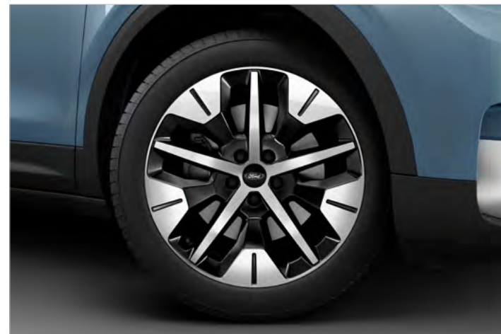
19" OBRĘCZE KÓŁ ZE STOPÓW LEKKICH, OGUMIENIE: PRZÓD 235/55, TYŁ: 255/50 Standard dla wersji EXPLORER