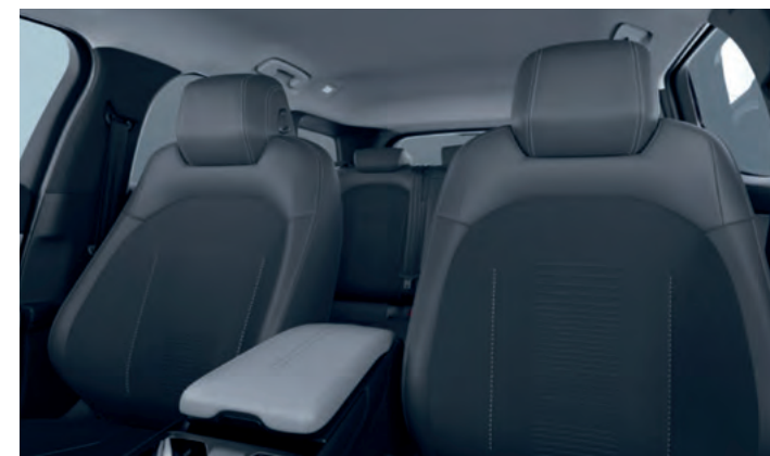
PRZEDNIE FOTELE ERGONOMICZNE, Z CERTYFIKATEM AGR, Z TAPICERKĄ CZĘŚCIOWO SKÓRZANĄ (SENSICO / ETON BLACK ONYX) Opcja dla wszystkich wersji