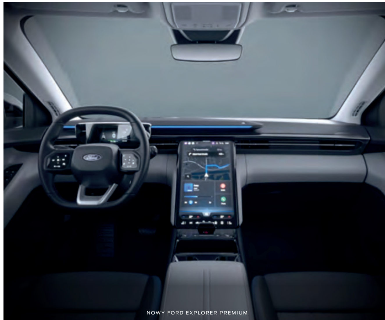
NOWY FORD EXPLORER PREMIUM