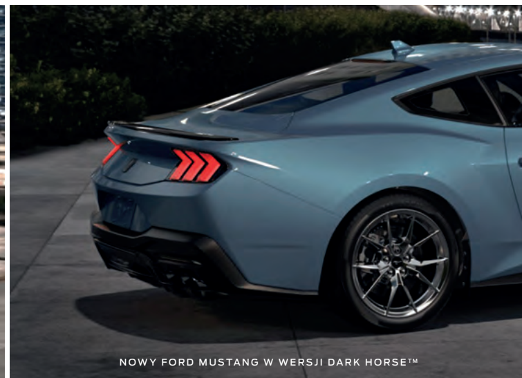
NOWY FORD MUSTANG W WERSJI DARK HORSE™

(ilustracje mogą nieznacznie różnić się od wersji produkcyjnej)