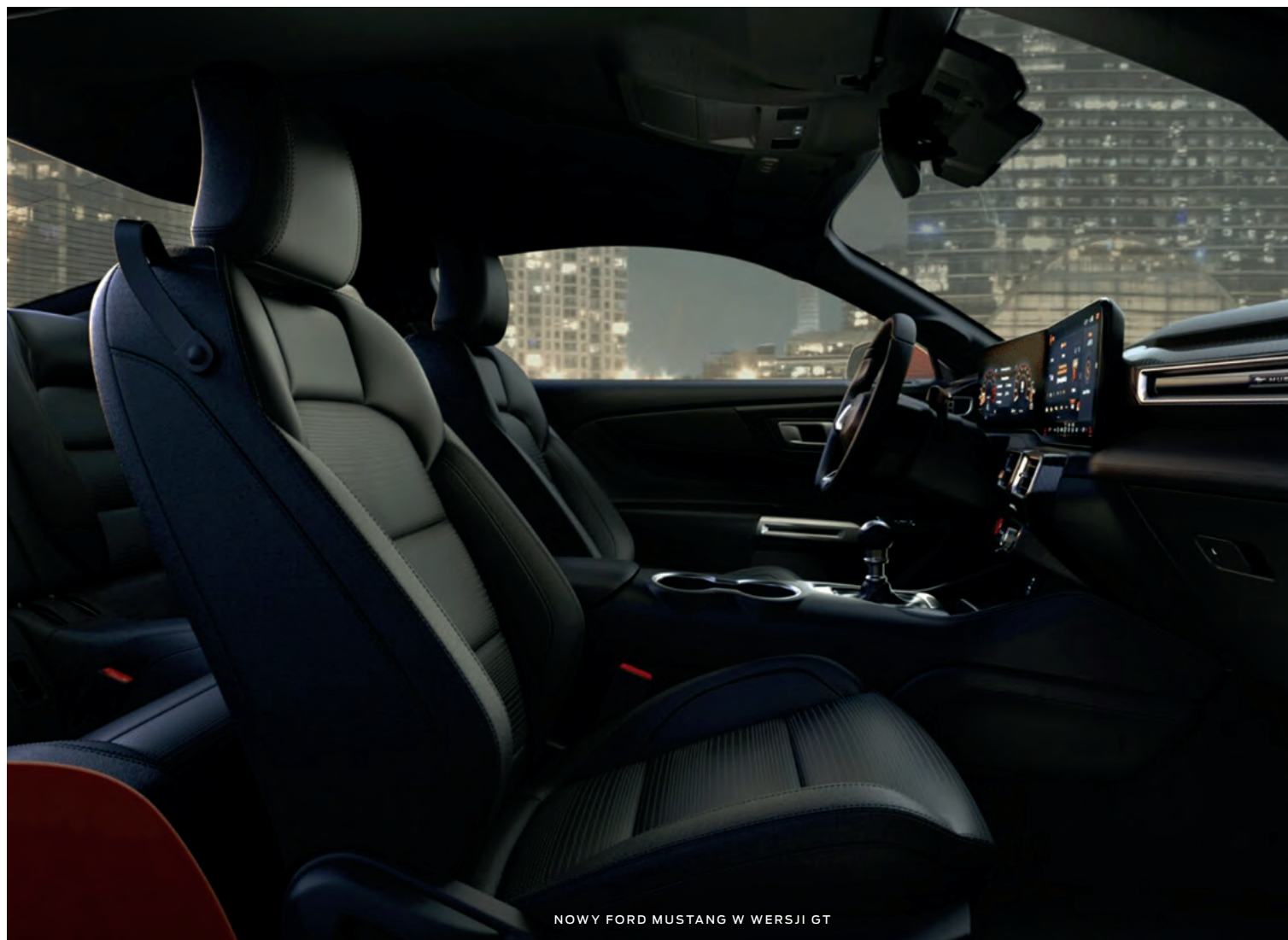
NOWY FORD MUSTANG W WERSJI GT

(ilustracje mogą nieznacznie różnić się od wersji produkcyjnej)