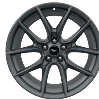
19" OBRĘCZE KÓŁ ZE STOPÓW LEKKICH STANDARD W WERSJI DARK HORSE™