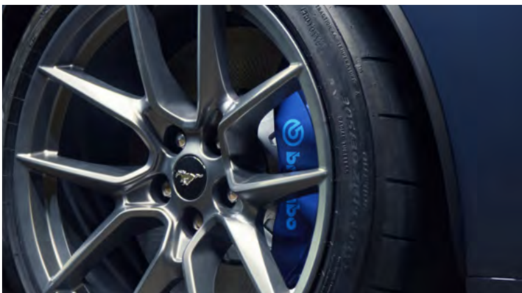
ZACISKI HAMULCOWE LAKIEROWANE NA NIEBIESKO, Z NIEBIESKIM LOGOTYPEM BREMBO™ Opcja dostępna tylko dla wersji DARK HORSE™ w pakiecie DARK HORSE™