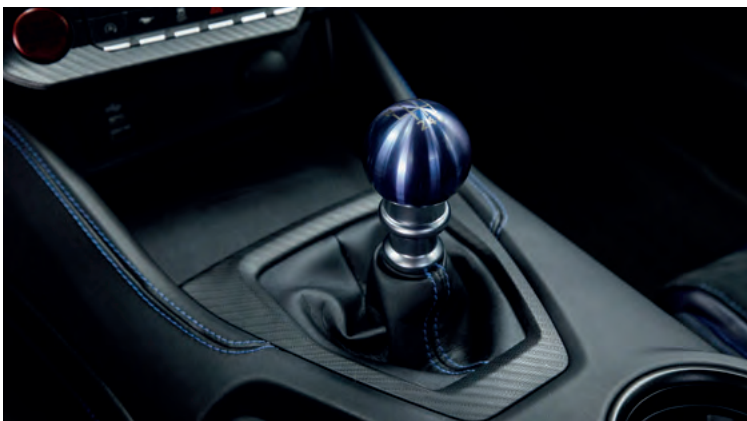
SPORTOWA, MANUALNA SKRZYŃNIA BIEGÓW TREMEC 3160 Standard dla wersji DARK HORSE™