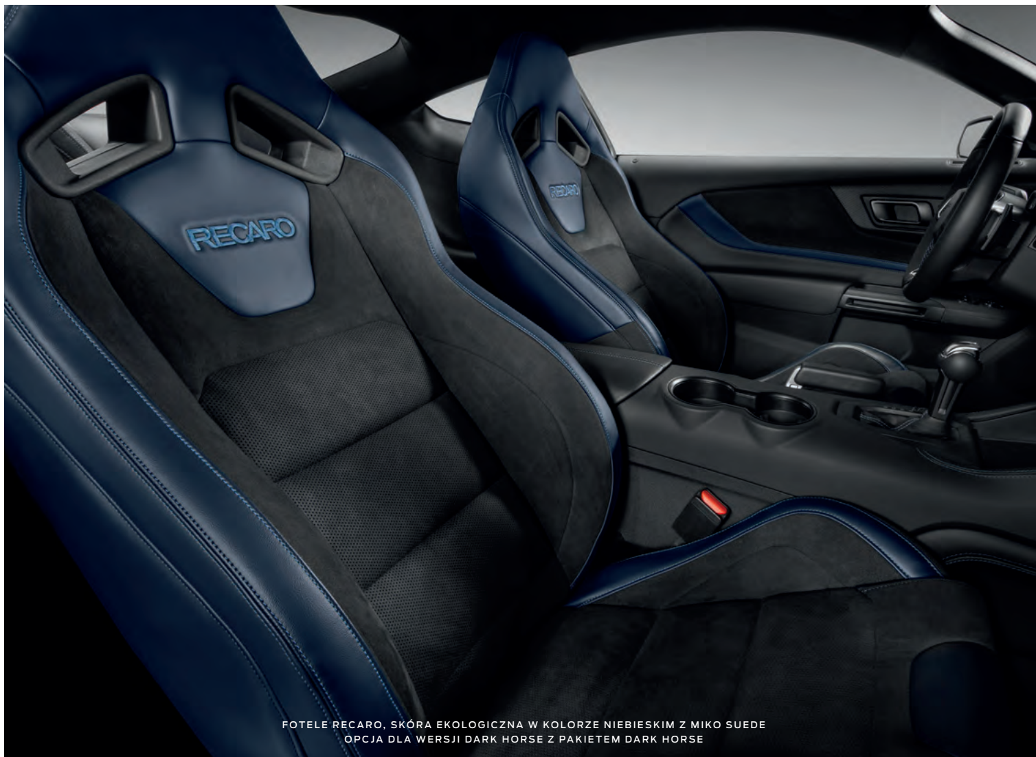
FOTELE RECARO, SKÓRA EKOLOGICZNA W KOLORZE NIEBIESKIM Z MIKO SUEDE OPCJA DLA WERSJI DARK HORSE Z PAKIETEM DARK HORSE