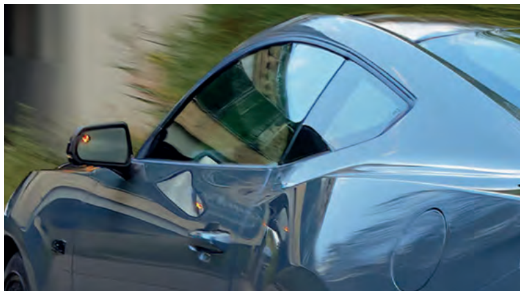
BLIND SPOT ASSIST Z CROSS TRAFFIC ALERT (CTA) - SYSTEM MONITOROWANIA MARTWEGO POLA WIDZENIA W LUSTERKACH Standard dla wszystkich wersji