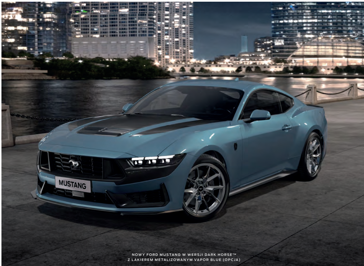
NOWY FORD MUSTANG W WERSJI DARK HORSE™ Z LAKIEREM METALIZOWANYM VAPOR BLUE (OPCJA)

(ilustracje mogą nieznacznie różnić się od wersji produkcyjnej)