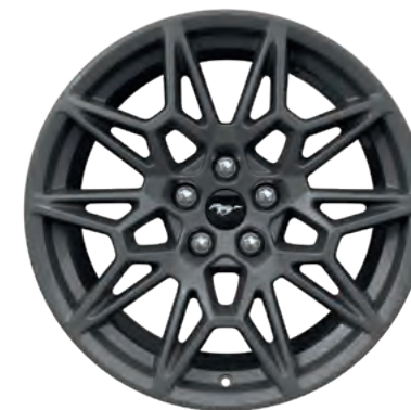
19" OBRĘCZE KÓŁ ZE STOPÓW LEKKICH STANDARD W WERSJI GT

(ilustracje mogą nieznacznie różnić się od wersji produkcyjnej)