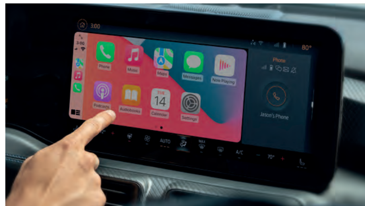
BEZPRZEWODOWA OBSŁUGA APPLE CARPLAY I ANDROID AUTO Standard dla wszystkich wersji