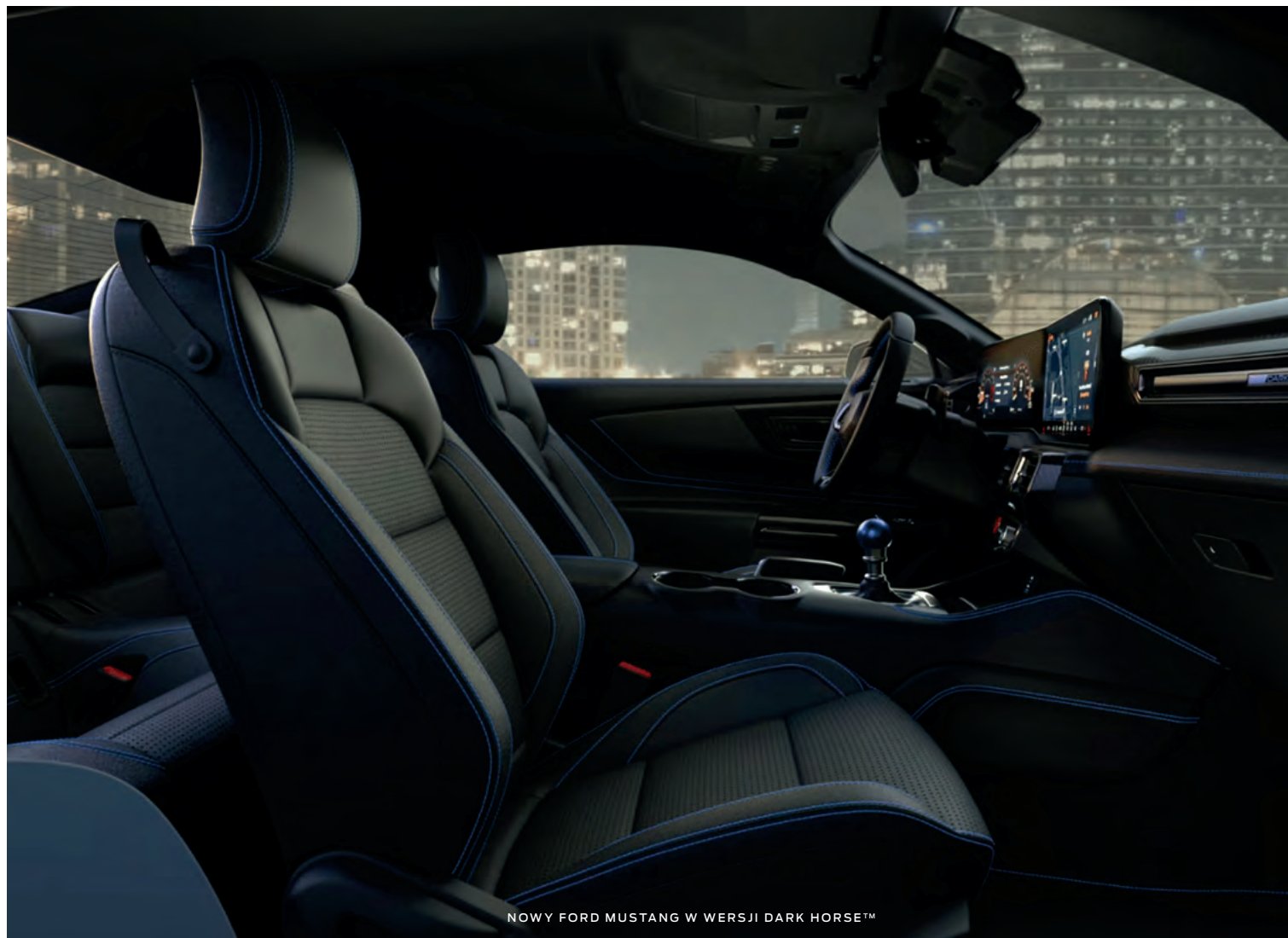
NOWY FORD MUSTANG W WERSJI DARK HORSE™

(ilustracje mogą nieznacznie różnić się od wersji produkcyjnej)