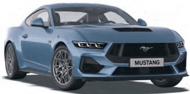
VAPOR BLUE - LAKIER METALIZOWANY SPECJALNY 6 200,-