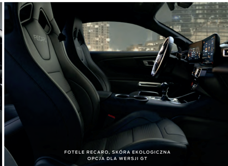
FOTELE RECARO, SKÓRA EKOLOGICZNA OPCJA DLA WERSJI GT