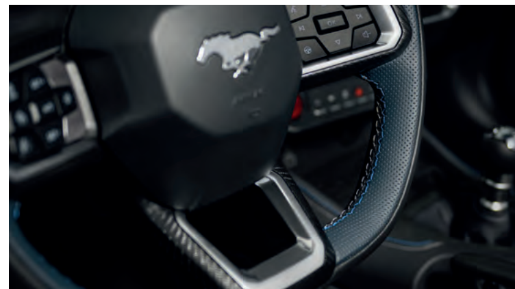
SPŁASZCZONA U DOŁU, PODGRZEWANA KIEROWNICA Standard dla wszystkich wersji. Dla wersji Dark Horse z niebieskimi przeszyciami