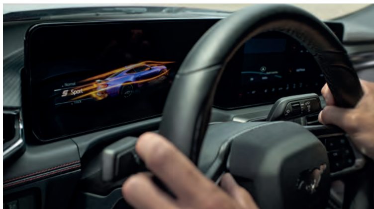
DRIVE MODE - SYSTEM WYBORU TRYBU JAZDY Standard dla wszystkich wersji