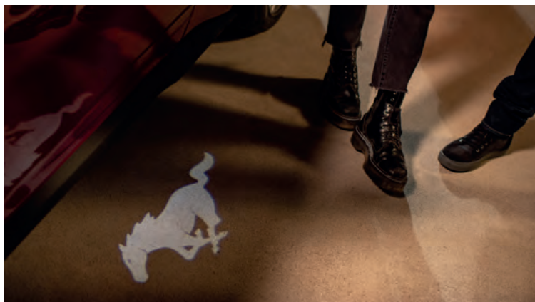
LUSTERKA BOCZNE Z PROJEKCJĄ LOGO „MUSTANG” Standard dla wszystkich wersji