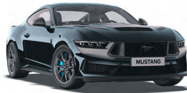
BLUE EMBER - LAKIER METALIZOWANY BEZ DOPŁATY - DOSTĘPNY TYLKO Z PAKIEM STYLIZACYJNYM DARK HORSE