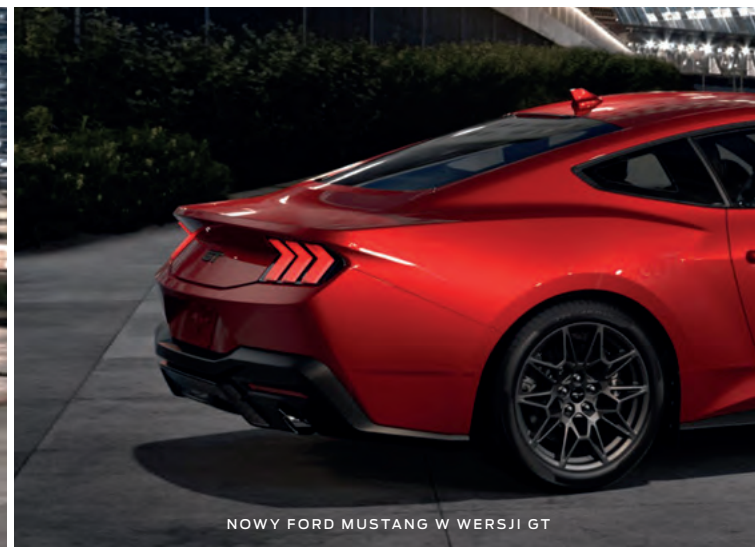
NOWY FORD MUSTANG W WERSJI GT