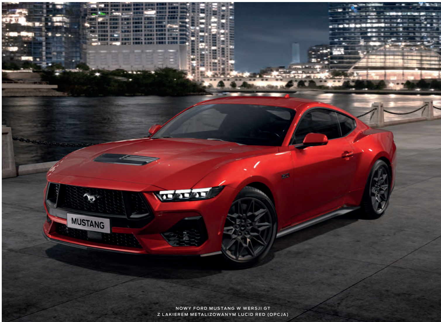
NOWY FORD MUSTANG W WERSJI GT Z LAKIEREM METALIZOWANYM LUCID RED (OPCJA)