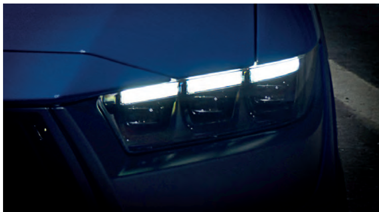
REFLEKTORY W TECHNOLOGII LED, Z CZARNYM TŁEM Standard dla wszystkich wersji Dark Horse. Dla wersji GT - z jasnym tłem