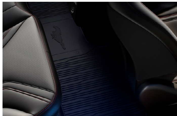
DYWANIKI PODŁOGOWE, GUMOWE - Z PRZODU I Z TYŁU (2 526 938)