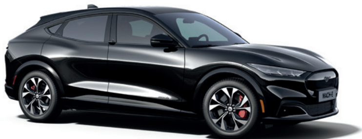
ABSOLUTE BLACK - LAKIER SPECJALNY bez dopłaty