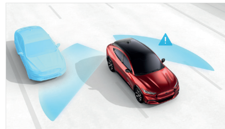
BLIND SPOT INFORMATION Standard dla wszystkich wersji