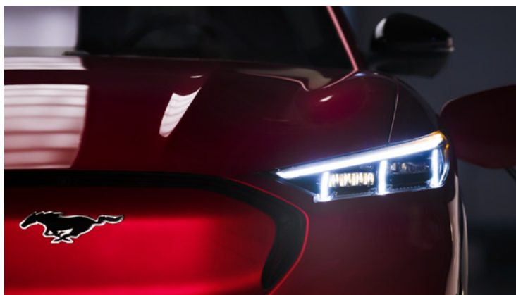
REFLEKTORY PROJEKCYJNE LED Standard dla wersji AWD i GT