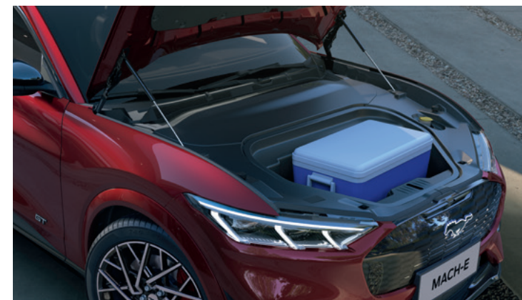
DODATKOWY BAGAŻNIK Z PRZODU POJAZDU O POJEMNOŚCI 81 LITRÓW Standard