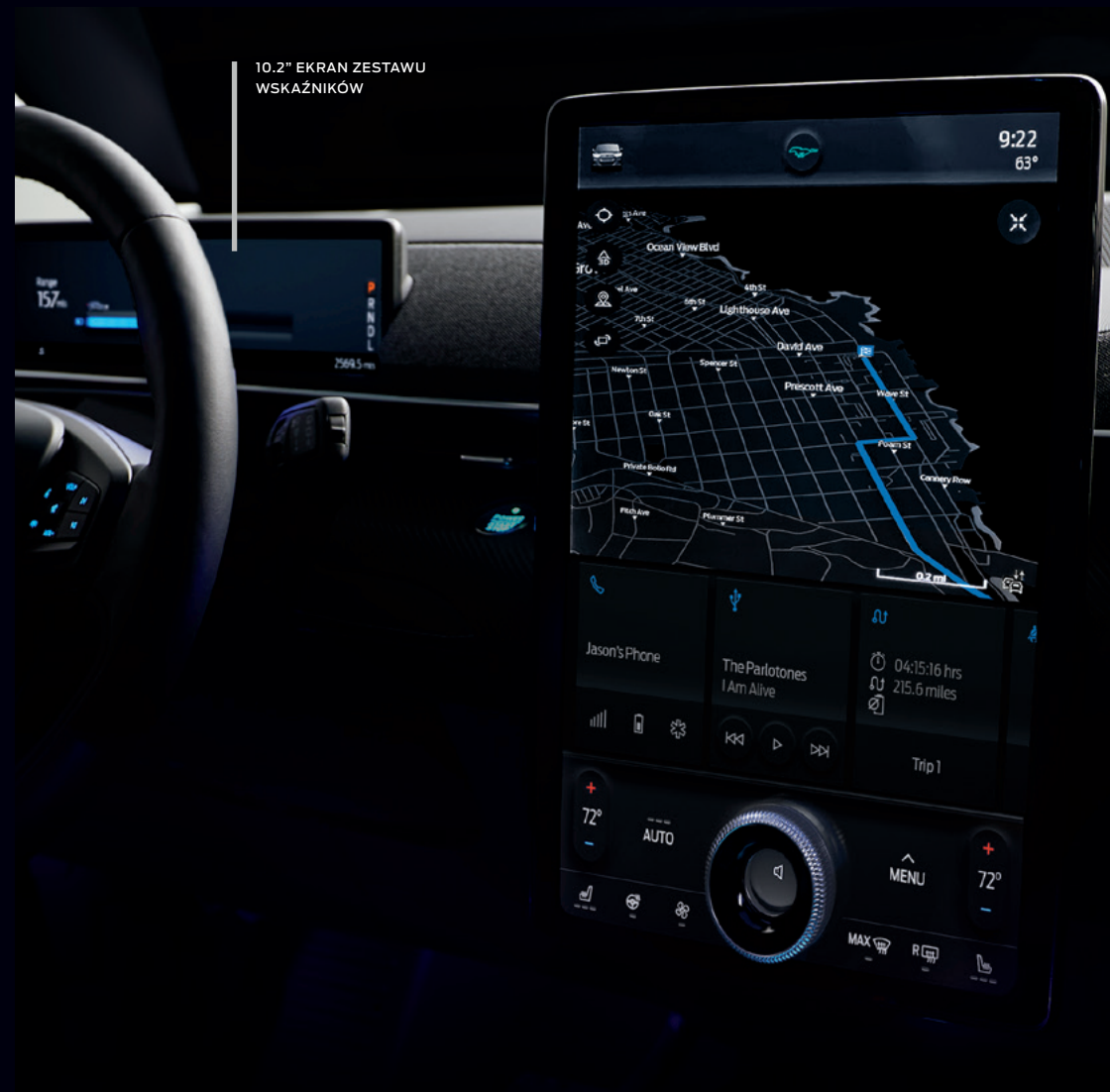
FORD MUSTANG MACH-E