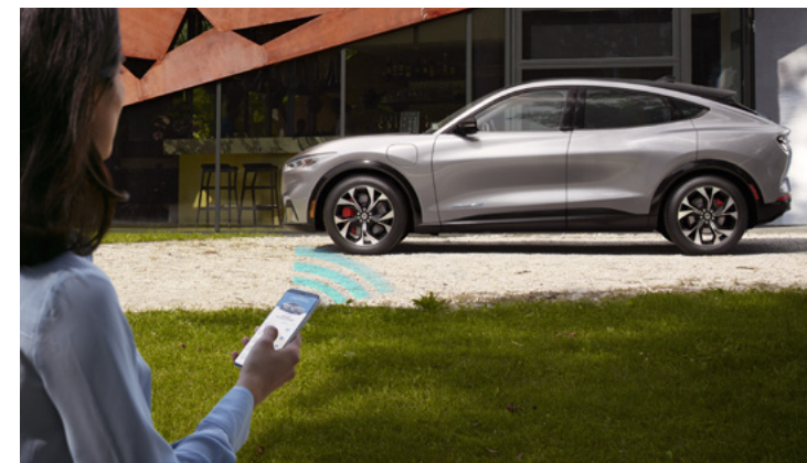
FUNKCJA OTWIERANIA, ZAMYKANIA ORAZ URUCHAMIANIA POJAZDU ZA POMOCĄ SMARTFONA Standard