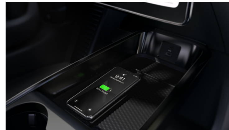
BEZPRZEWODOWA ŁADOWARKA Standard dla wszystkich wersji