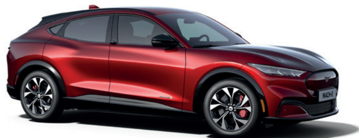
LUCID RED - LAKIER METALIZOWANY SPECJALNY 5 000,-