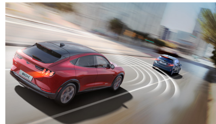
AKTYWNY TEMPOMAT Z FUNKCJĄ UTRZYMANIA POJAZDU NA ŚRODKU PASA RUCHU Standard dla wszystkich wersji