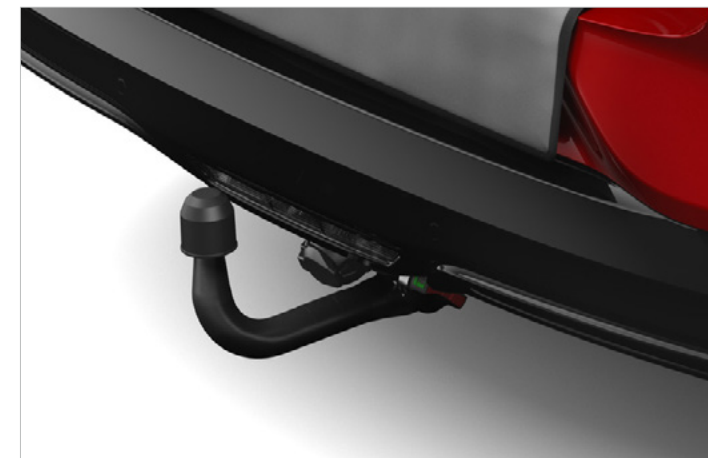
HAK HOLOWNICZY - ODŁĄCZANY (2 483 493)