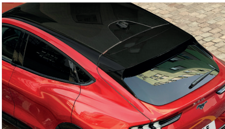
DACH PANORAMICZNY - NIEOTWIERANY Dla wersji RWD i AWD Opcja dostępna w pakietach Technology oraz Technology Plus Dla wersji GT opcja dostępna w pakiecie Technology GT