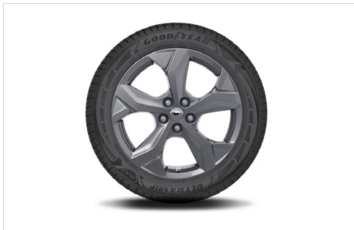
KOMPLETNE KOŁA ZIMOWE ALUMINIOWE 18" Z OPONAMI GOODYEAR UG PERF SUV G1 XL, 225/60 R18 104V (2 485 238)