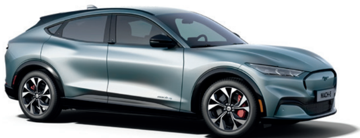
ICED BLUE SILVER - LAKIER METALIZOWANY 3 400,-