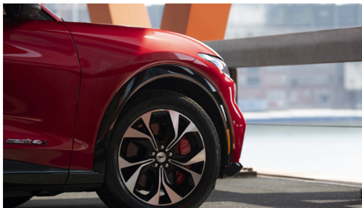
OSŁONY NADKOLI LAKIEROWANE W KOLORZE CZARNYM Standard dla wersji AWD