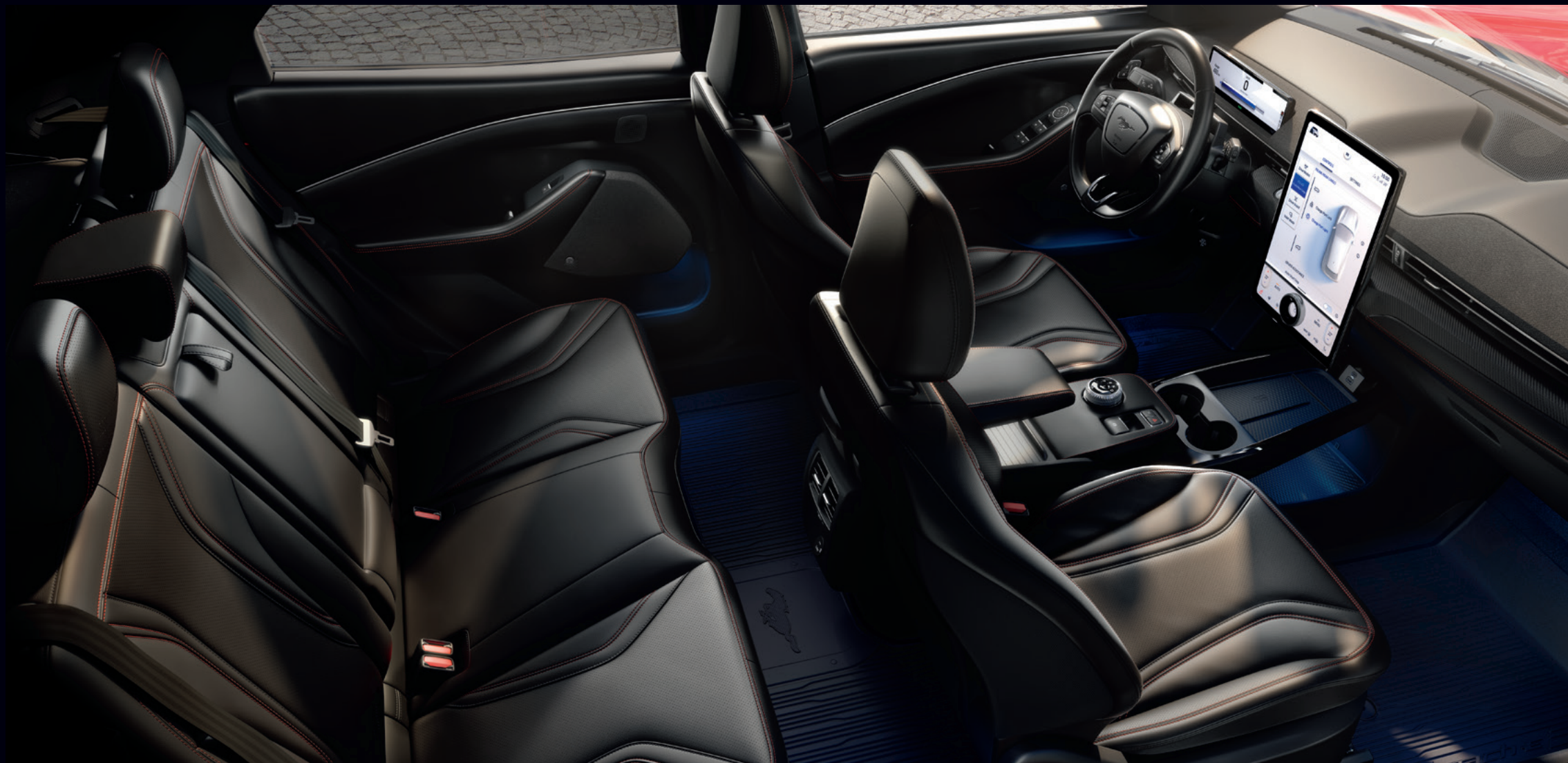
FORD MUSTANG MACH-E | AWD