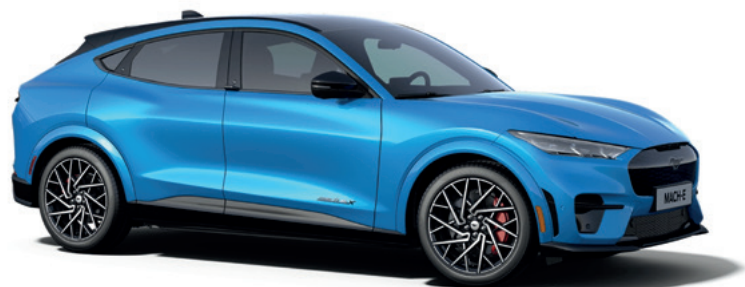
GRABBER BLUE - LAKIER METALIZOWANY 5 000,-