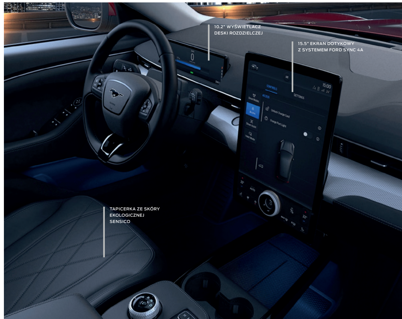
FORD MUSTANG MACH-E | RWD