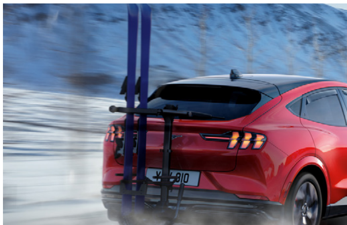
UCHWYT NA NARTY MONTOWANY DO HAKA HOLOWNICZEGO (2 483 279)