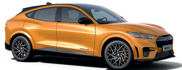
CYBER ORANGE - LAKIER METALIZOWANY SPECJALNY 5 000,-