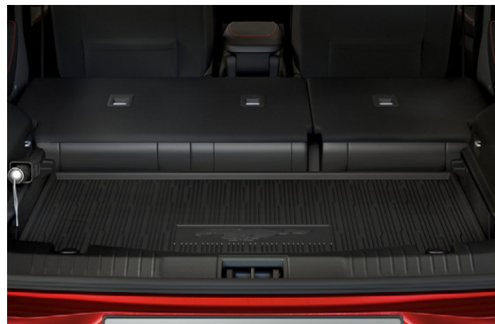
MATA GUMOWA DO BAGAŻNIKA Z LOGO MUSTANGA (2 465 296)