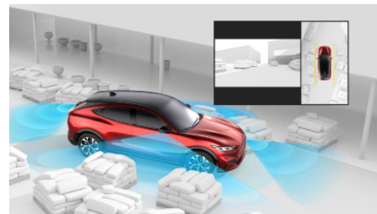
SYSTEM KAMER 360 STOPNI Dla wersji RWD i AWD Opcja dostępna w pakietach Technology oraz Technology Plus Standard dla wersji GT