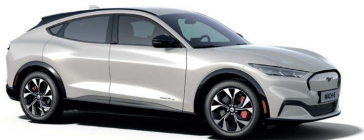
STAR WHITE - LAKIER METALIZOWANY SPECJALNY 5 000,-