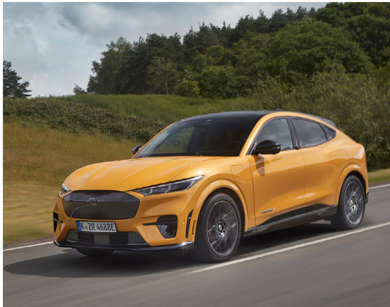
FORD MUSTANG MACH-E | GT | KOLOR NADWOZIA CYBER ORANGE (OPCJA) | SAMOCHÓD NA ZDJĘCIU WYPOSAŻONY W DACH PANORAMICZNY (OPCJA)