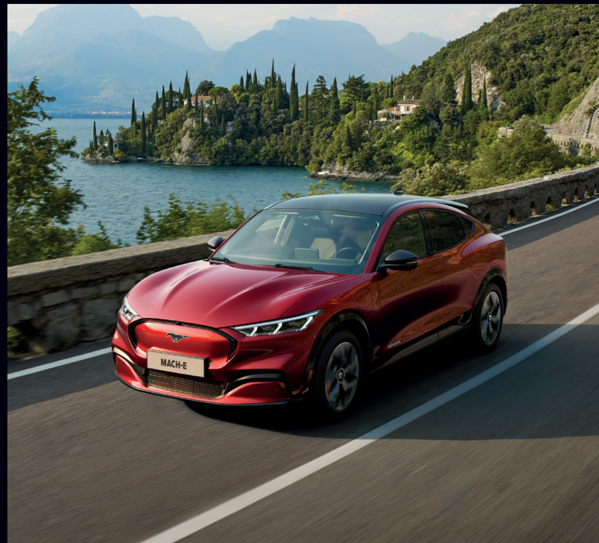
FORD MUSTANG MACH-E | AWD | KOLOR NADWOZIA LUCID RED (OPCJA) | SAMOCHÓD NA ZDJĘCIU WYPOSAŻONY W PAKIET TECHNOLOGY PLUS (OPCJA)

Wyraź siebie wybierając jeden z elektryzujących lakierów Mustanga MACH-E.