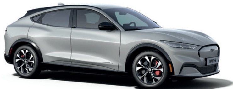
SPACE WHITE - LAKIER METALIZOWANY 3 400,-