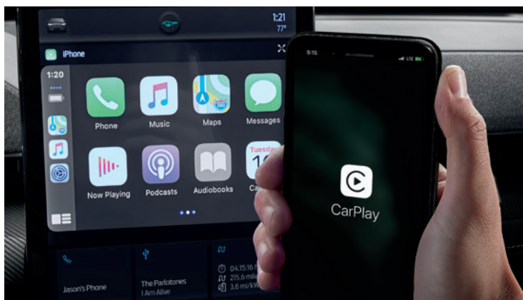
BEZPRZEWODOWA OBSŁUGA APPLE CARPLAY I ANDROID AUTO Standard dla wszystkich wersji. Wymaga kompatybilnego urządzenia.