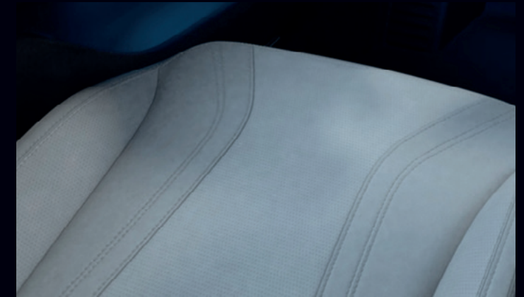
JASNA TAPICERKA PERFOROWANA SENSICO