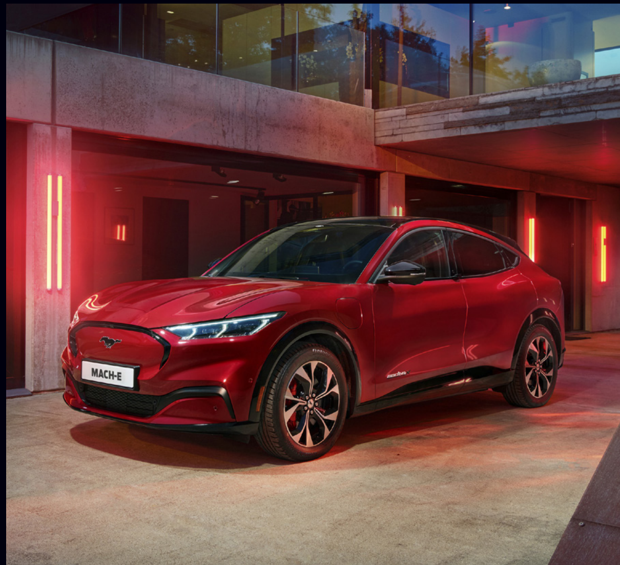
FORD MUSTANG MACH-E

Jury konkursu składa się z doświadczonych dziennikarzy motoryzacyjnych, będących autorytetami w swojej branży, zawodowo zajmujących się testowaniem i oceną samochodów. Pochodzą oni z różnych mediów i redakcji, dzięki czemu konkurs jest w pełni niezależny, demokratyczny, ponadredakcyjny i transparentny.