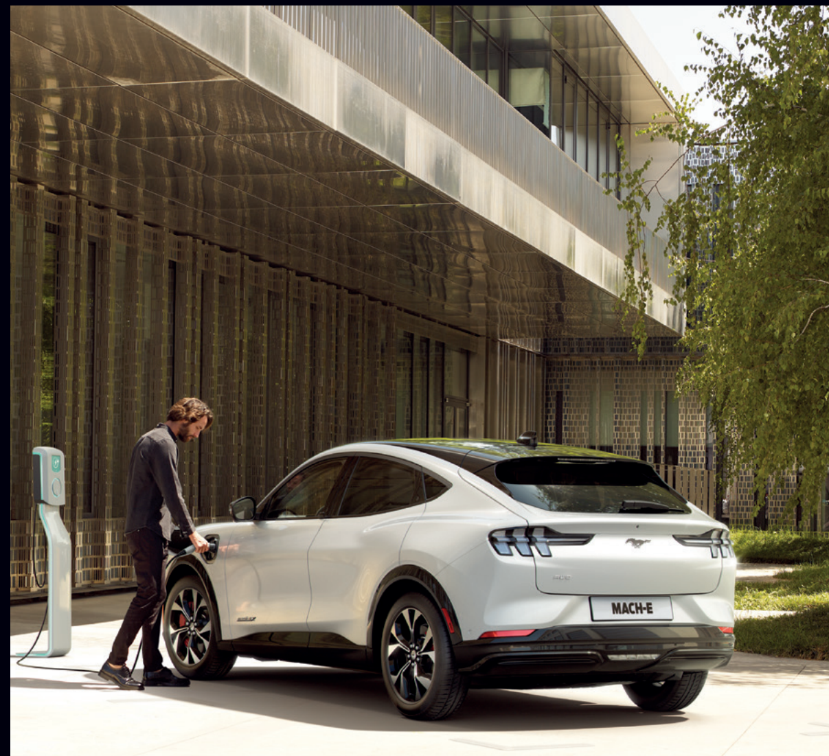
FORD MUSTANG MACH-E

Warto zapoznać się z aktualną bazą stacji przy planowaniu swojej podróży. System SYNC 4A w Mustangu Mach-E w prosty sposób pomoże Ci znaleźć pobliskie stacje ładowania i pokaże jak do nich dojechać.