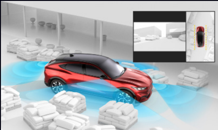
SYSTEM KAMER 360 STOPNI