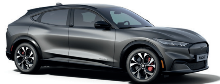
DARK MATTER GREY - LAKIER METALIZOWANY 5 000,-