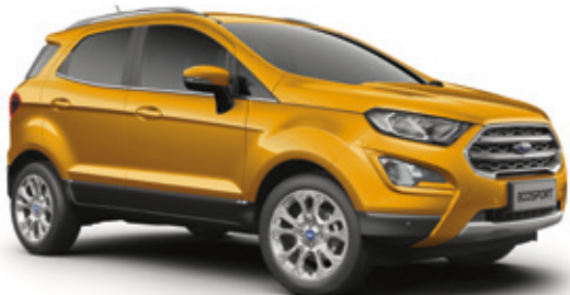
LUXE YELLOW - LAKIER METALIZOWANY