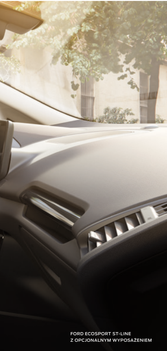
FORD ECOSPORT ST-LINE Z OPCJONALNYM WYPOSAŻENIEM

Wnętrze Forda EcoSport cechuje się wzorową stylistyką, współgrającą z perfekcyjną ergonomią. Najważniejsze funkcje są dostępne pod dedykowanymi przyciskami a ekran dotykowy obsługuje się intuicyjnie. We wnętrzu znajdziemy materiały najwyższej jakości, miękkie i przyjemne w dotyku oraz idealnie spasowane. Dodatkowo każda z wersji wyposażenia wyróżnia się unikalnymi elementami, takimi jak na przykład przeszycia na tapicerce czy kierownicy, podkreślającymi jej unikalny charakter.