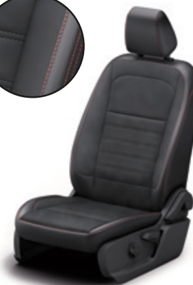
TAPICERKA CZĘŚCIOWO SKÓRZANA (SKÓRA EKOLOGICZNA)