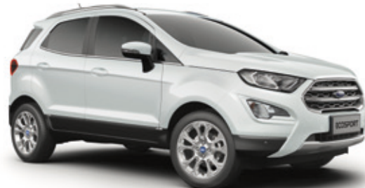
FROZEN WHITE - LAKIER ZWYKŁY