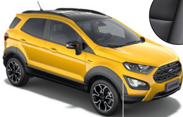
LAKIER METALIZOWANY LUXE YELLOW (OPCJA)