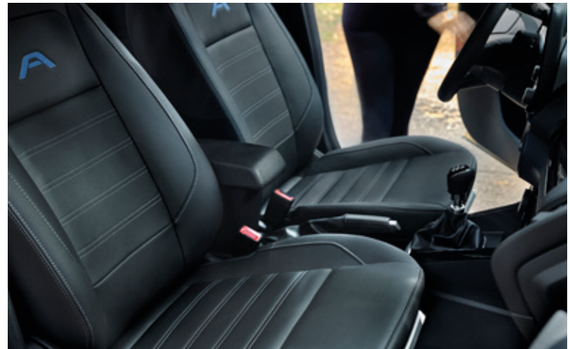
FORD ECOSPORT ACTIVE (STANDARD)