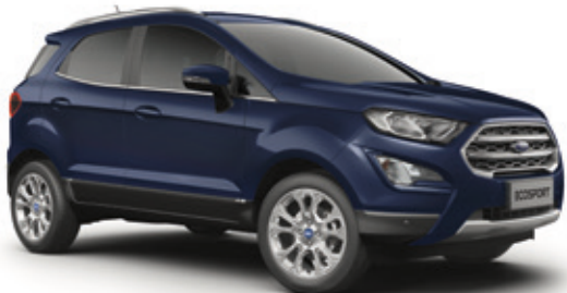
BLAZER BLUE - LAKIER ZWYKŁY

Bez dopłaty | niedostępny dla wersji Active