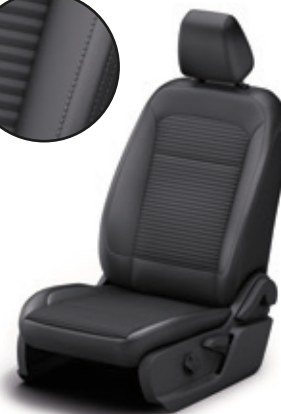
TAPICERKA CZĘŚCIOWO SKÓRZANA (SKÓRA EKOLOGICZNA)