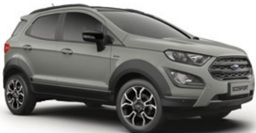
GREY MATTER - LAKIER SPECJALNY