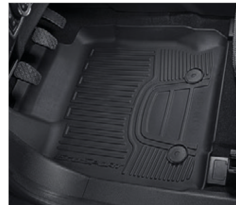
DYWANIKI PODŁOGOWE - PRZÓD, 2 SZT. (2 268 334) WSZYSTKIE WERSJE | 264,-