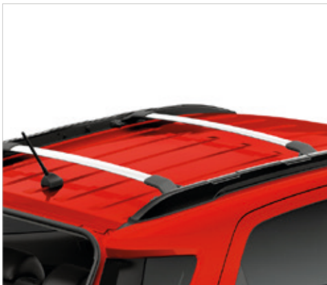
BAGAŻNIK DACHOWY (1 876 580) WSZYSTKIE WERSJE WYPOSAŻONE W RELINGI | 1109,-