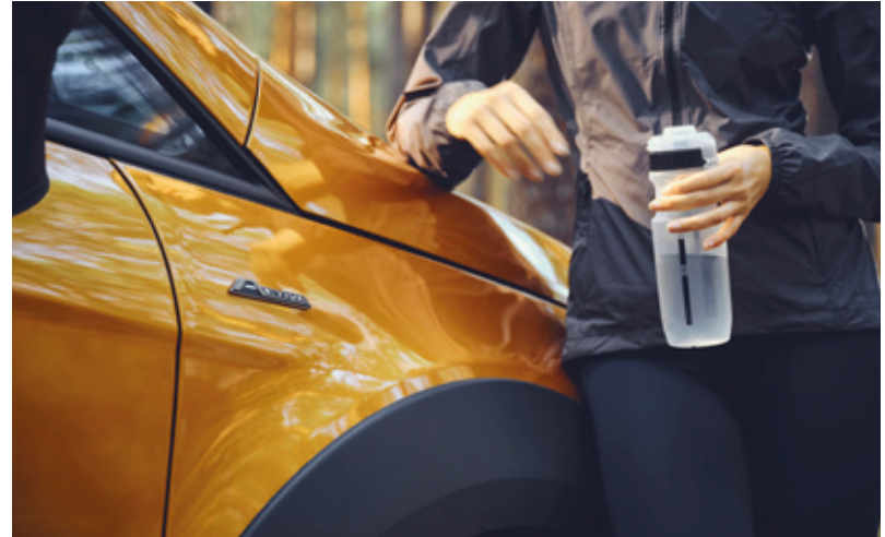
FORD ECOSPORT ACTIVE (STANDARD)

RATA MIESIĘCZNA NETTO LEASING Z KORZYSTNĄ RATĄ FORD LEASING OPCJE 2