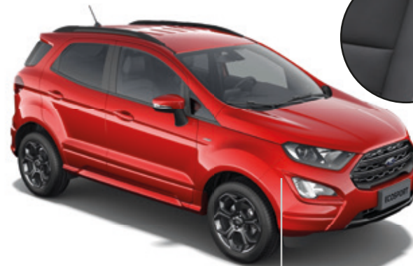
LAKIER METALIZOWANY SPECJALNY FANTASTIC RED (OPCJA)

RATA MIESIĘCZNA NETTO LEASING Z KORZYSTNĄ RATĄ FORD LEASING OPCJE 2