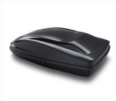
BOX DACHOWY ELEGANCE EUROPE 330 PREMIUM (2 191 625) WSZYSTKIE WERSJE WYPOSAŻONE W BAGAŻNIK DACHOWY | 1292,-