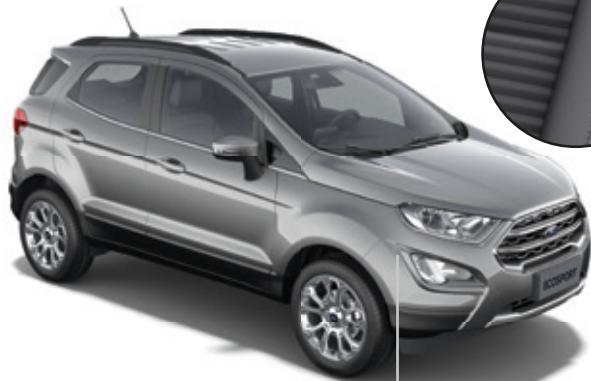
LAKIER METALIZOWANY SOLAR SILVER (OPCJA)