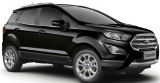
AGATE BLACK - LAKIER METALIZOWANY

Bez dopłaty | niedostępny dla wersji Active