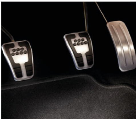
SPORTOWE NAKŁADKI NA PEDAŁY (1 835 213) WSZYSTKIE WERSJE | 250,-