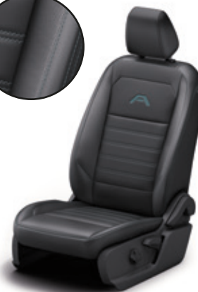
TAPICERKA SKÓRZANA (SKÓRA EKOLOGICZNA)