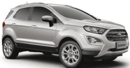
SOLAR SILVER - LAKIER METALIZOWANY