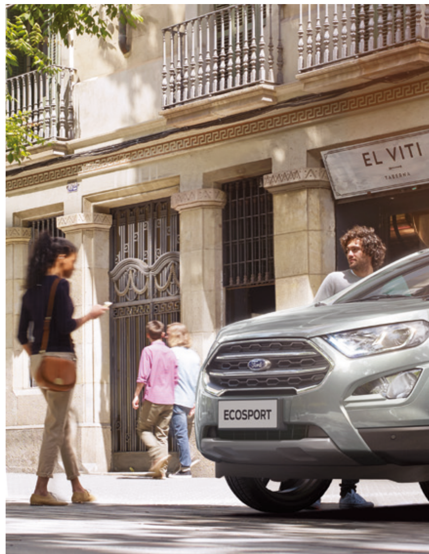
FORD ECOSPORT TITANIUM W KOLORZE MAGNETIC GREY (OPCJA)