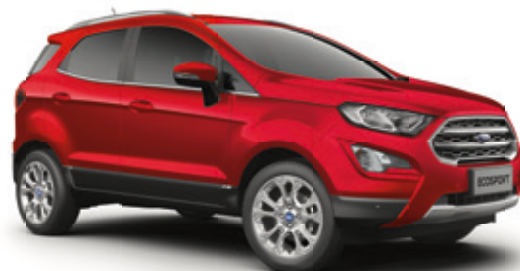
FANTASTIC RED - LAKIER METALIZOWANY SPECJALNY