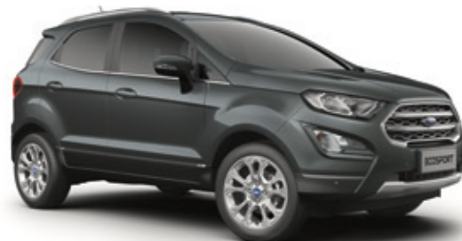
MAGNETIC GREY - LAKIER METALIZOWANY