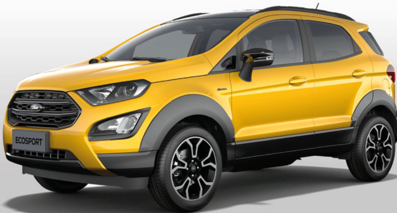
FORD ECOSPORT ACTIVE Z LAKIEREM METALIZOWANYM LUXE YELLOW ORAZ Z WYPOSAŻENIEM OPCJONALNYM

Ford EcoSport został zaprojektowany z myślą o miejskiej dżungli. To urodzony zdobywca ciasnych miejsc parkingowych, wysokich krawężników i progów spowalniających. To Twój najlepszy towarzysz każdej podróży.