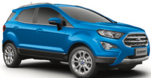
DESERT ISLAND BLUE - LAKIER METALIZOWANY