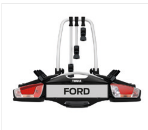
THULE® BAGAŻNIK ROWEROWY, NA 3 ROWERY, SKŁADANY I ODCHYLANY, MOCOWANY NA HAKU (2 353 444)