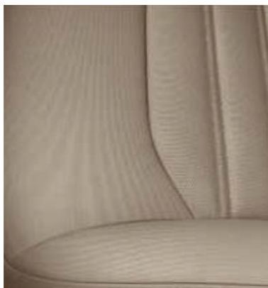
Cypress w tonacji Dune (Standard w wersjach Trend oraz Edition)