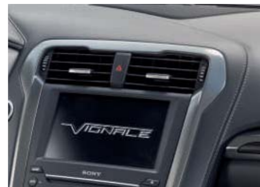
Ekran powitalny Vignale i deska rozdzielcza wykończona skórą