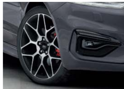
19" obręcze kół ze stopów lekkich, wzór 7x2-ramienny z wykończeniem Mica Shadow Black/maszynowym (opcja)