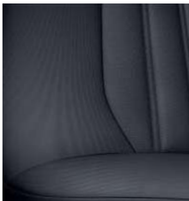
Cypress w tonacji Ebony z białymi kropkami (Standard w wersjach Trend oraz Edition)