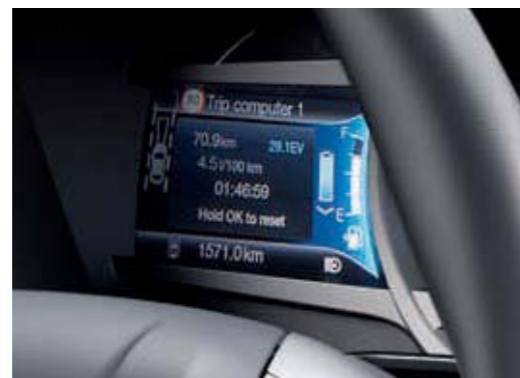
Wyświetlacz na tablicy zegarów samochodu z napędem hybrydowym