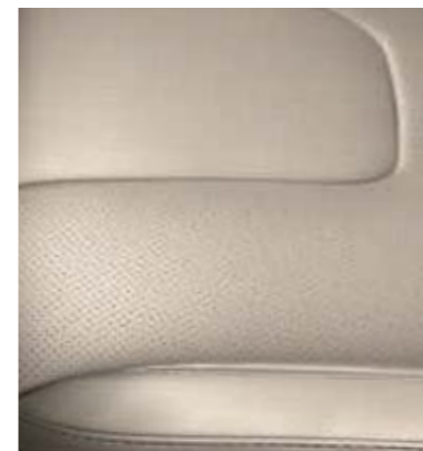
Tapicerka skórzana Salerno w tonacji Medium Soft Ceramic (Opcja w wersjach Titanium oraz Titanium Hybrid)