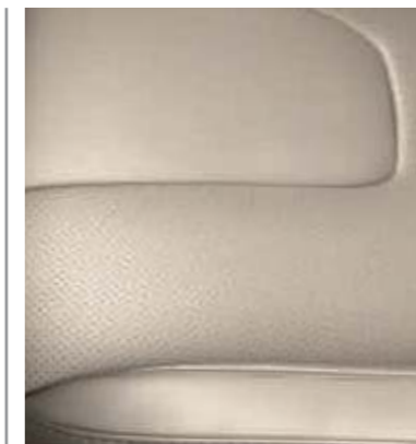
Skóra perforowana Salerno w tonacji Medium Soft Ceramic (Opcja w wersjach Titanium oraz Titanium Hybrid)