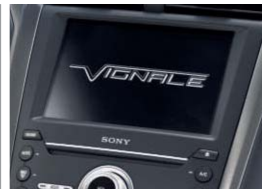
Ford SYNC 3 z 8" ekranem dotykowym