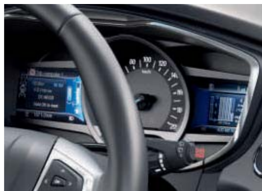
Wyświetlacz zestawu wskaźników z funkcją SmartGauge®