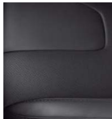
Tapicerka skórzana Salerno w kolorze Charcoal Black (Opcja w wersjach Titanium oraz Titanium Hybrid)