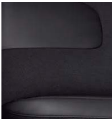
Częściowo skórzana tapicerka Miko Suede/Salerno w kolorze Charcoal Black (Opcja w wersjach Titanium oraz Titanium Hybrid)