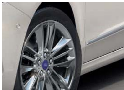
18" obręcze kół ze stopów lekkich