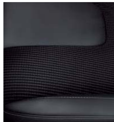
Tapicerka częściowo skórzana Smitty/Salerno w kolorze Charcoal Black (Opcja w wersjach Titanium i Titanium Hybrid)