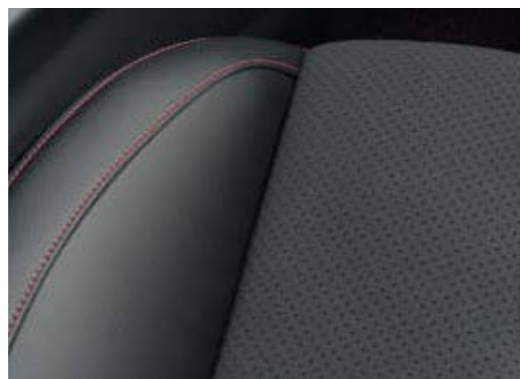
Fotele z tapicerką częściowo skórzaną ciemną Miko Suede/ Salerno (opcja)