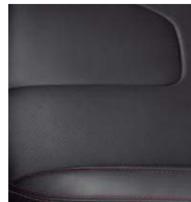
Tapicerka skórzana Salerno w kolorze Charcoal Black z czerwonymi szwami (Opcja w wersji ST-Line X)