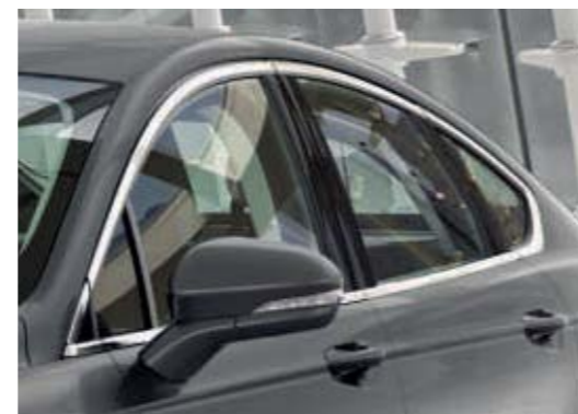
Szyby boczne z obramowaniem w kolorze chromu