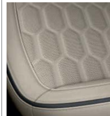
Tapicerka skórzana Lux w tonacji Cashmere (Bezpłatna opcja w wersjach Vignale oraz Vignale Hybrid)