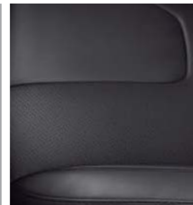
Skóra perforowana Salerno w kolorze Charcoal Black (Opcja w wersjach Titanium oraz Titanium Hybrid)