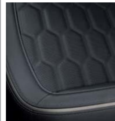
Tapicerka skórzana Lux w kolorze Charcoal Black (Standard w wersjach Vignale oraz Vignale Hybrid)