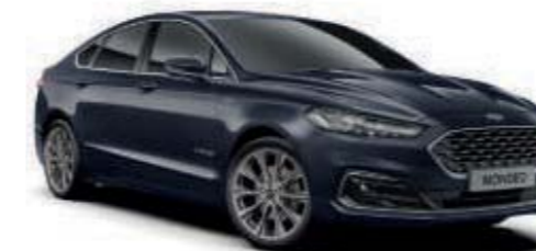
Panther Blue ‡