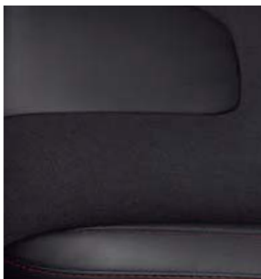
Częściowo skórzana tapicerka Miko Suede/Salerno z czerwonymi przeszyciami (Opcja w wersji ST-Line X)