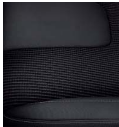
Smitty/Omni w kolorze Charcoal Black (Standard w wersjach Titanium oraz Titanium Hybrid, opcja w wersjach Trend oraz Edition)