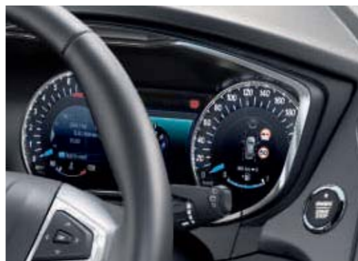
10" kolorowy wyświetlacz na tablicy zegarów