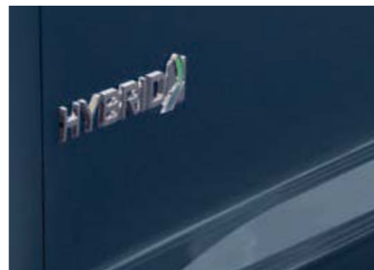
Emblemat Hybrid na boku nadwozia