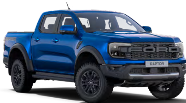
BLUE LIGHTNING - LAKIER METALIZOWANY 3 200,-