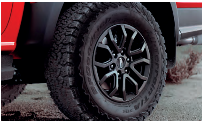
17" OBRĘCZE KÓŁ ZE STOPÓW LEKKICH Standard