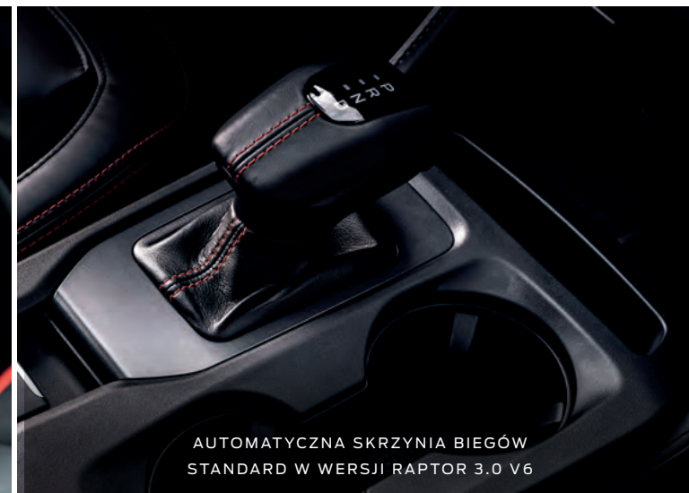
AUTOMATYCZNA SKRZYŃNIA BIEGÓW STANDARD W WERSJI RAPTOR 3.0 V6