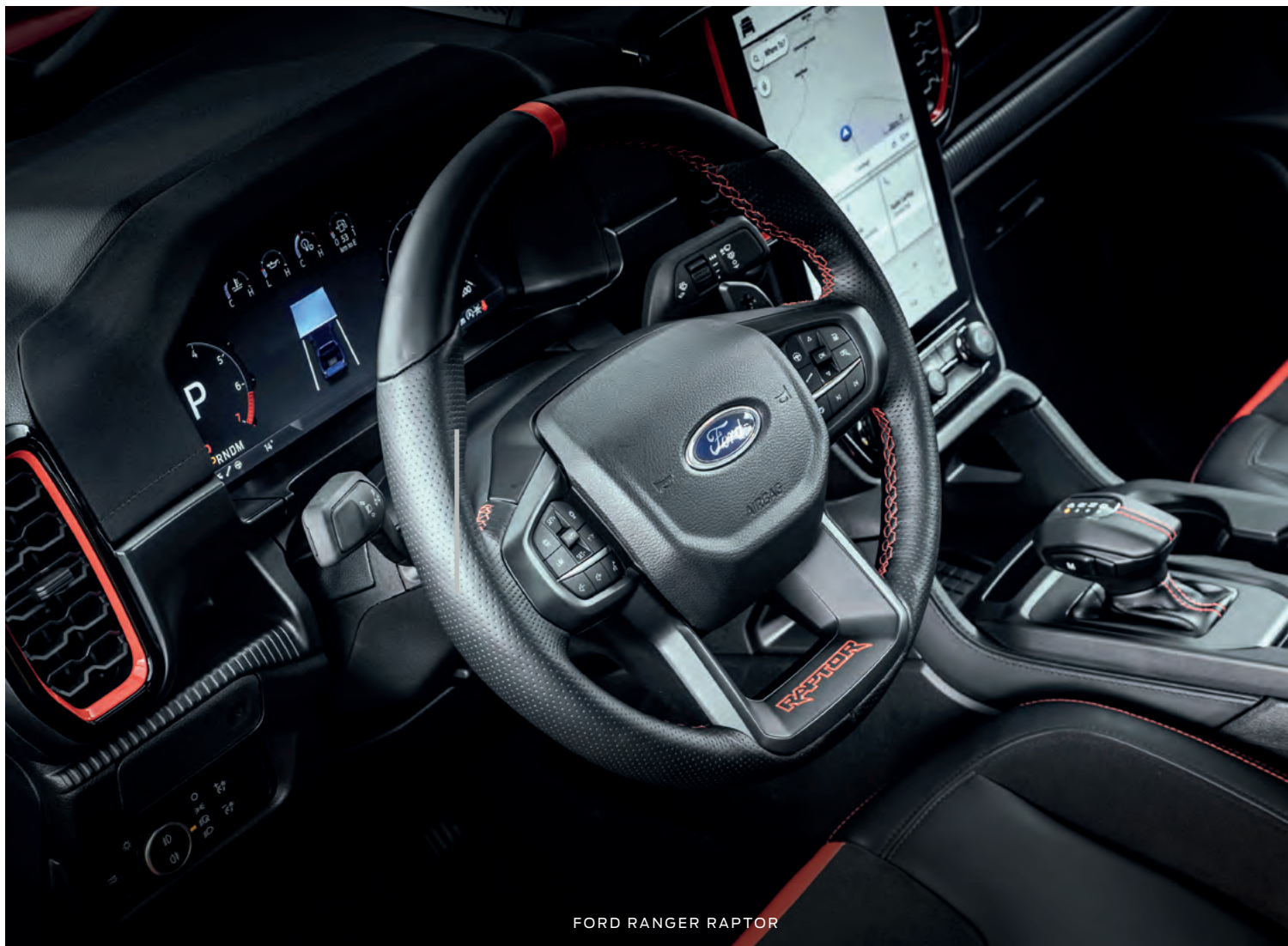
FORD RANGER RAPTOR