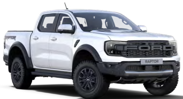
ARCTIC WHITE - LAKIER ZWYKLY bez dopłaty