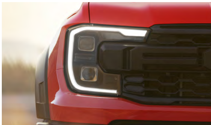
MATRYCOWE, ADAPTACYJNE REFLEKTORY W TECHNOLOGII LED Standard