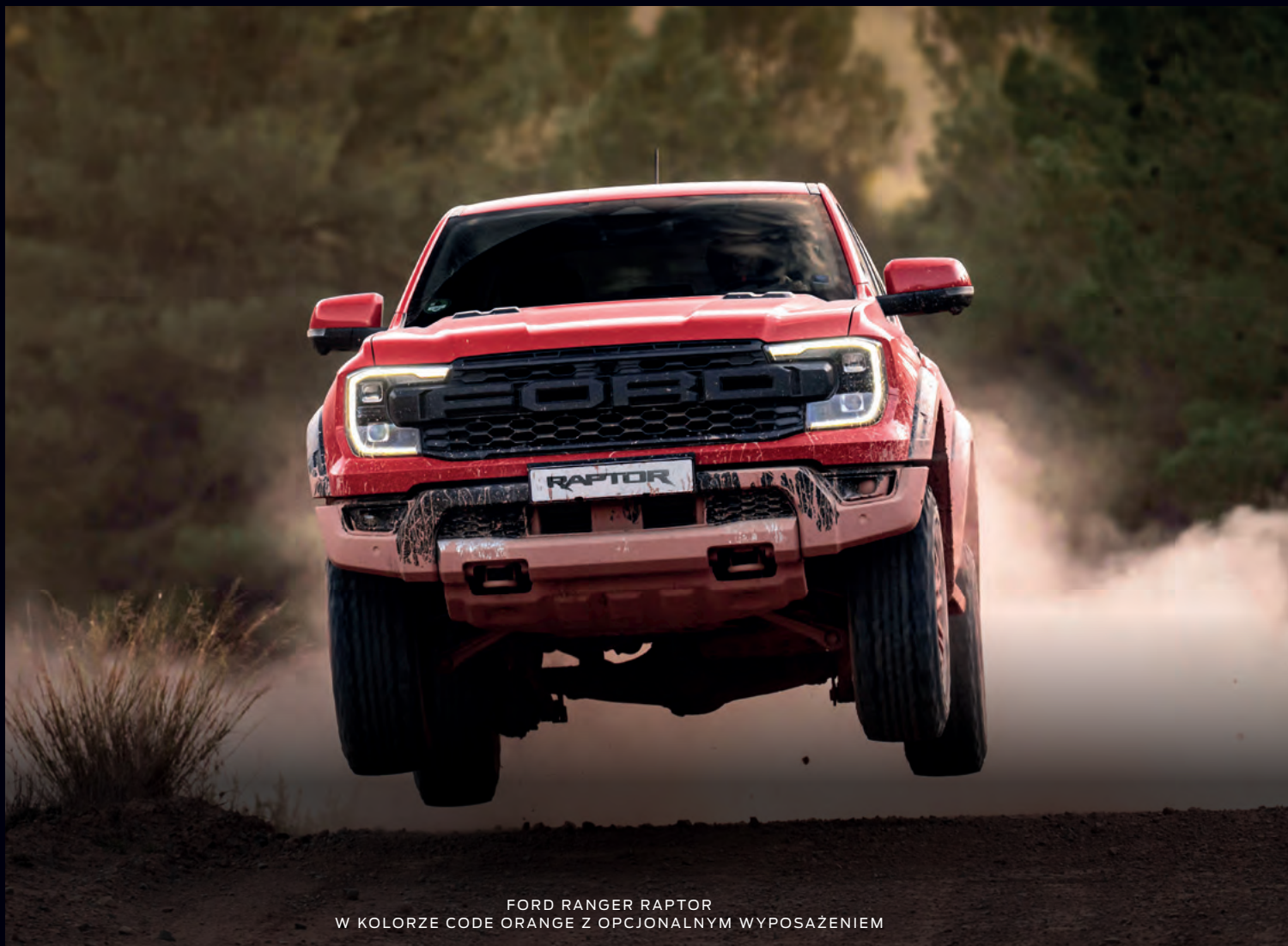
FORD RANGER RAPTOR W KOLORZE CODE ORANGE Z OPCJONALNYM WYPOSAŻENIEM