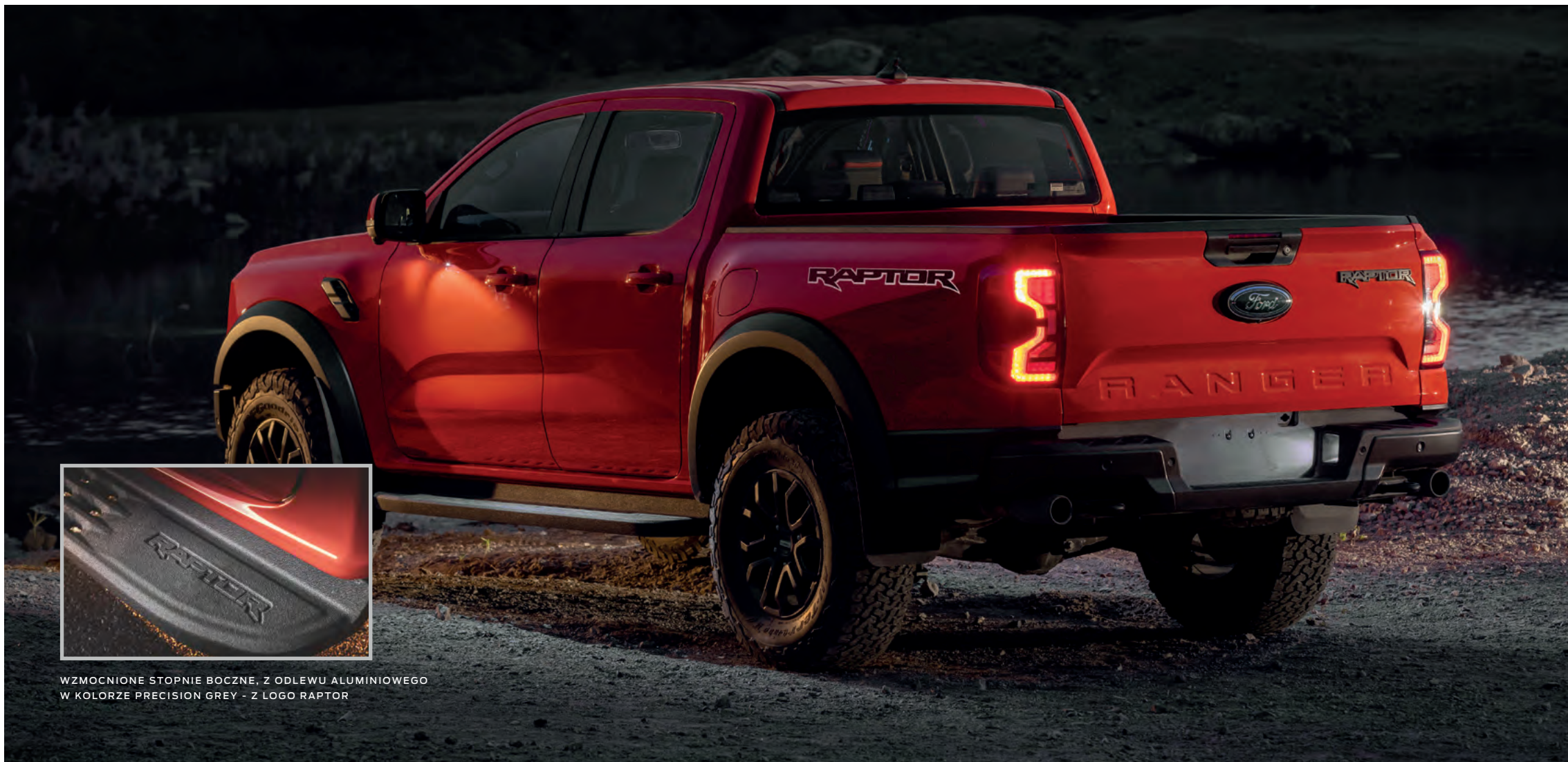
WZMOCNIONE STOPNIE BOCZNE, Z ODLEWU ALUMINIOWEGO W KOLORZE PRECISION GREY - Z LOGO RAPTOR