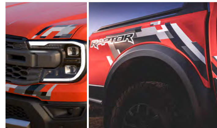
NAKLEJKI RAPTOR NA TYLNE BŁOTNIKI I PRZÓD POJAZDU