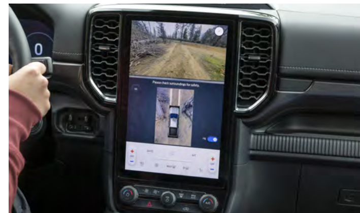
SYSTEM KAMER 360 STOPNI