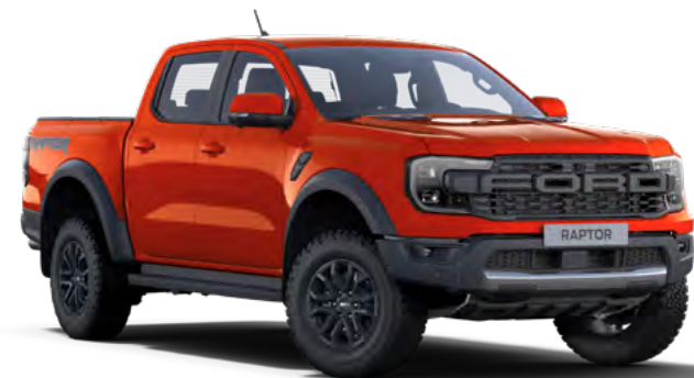
CODE ORANGE - LAKIER PERFORMANCE 3 200,-