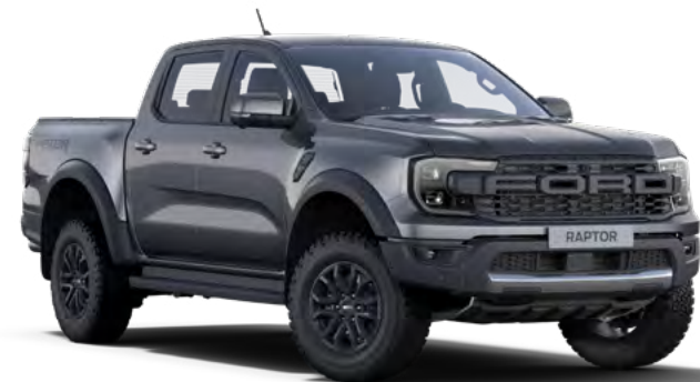
METEOR GREY - LAKIER METALIZOWANY 3 200,-