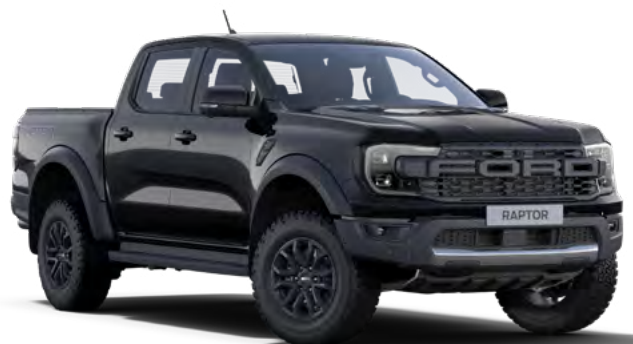
ABSOLUTE BLACK - LAKIER METALIZOWANY 3 200,-