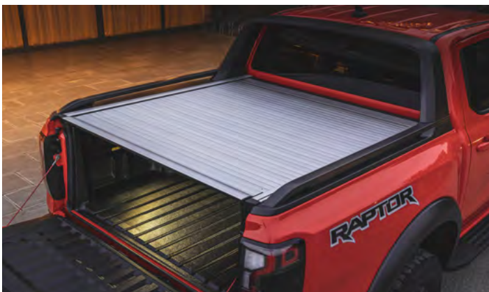
ELEKTRYCZNA ROLETA SKRZYNI ŁADUNKOWEJ ORAZ SPORTOWA CZARNA NAKŁADKA SKRZYNI ŁADUNKOWEJ 8 600,-