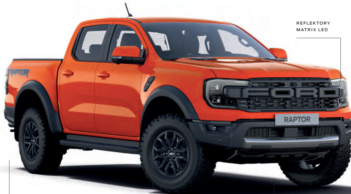
REFLEKTORY MATRIX LED