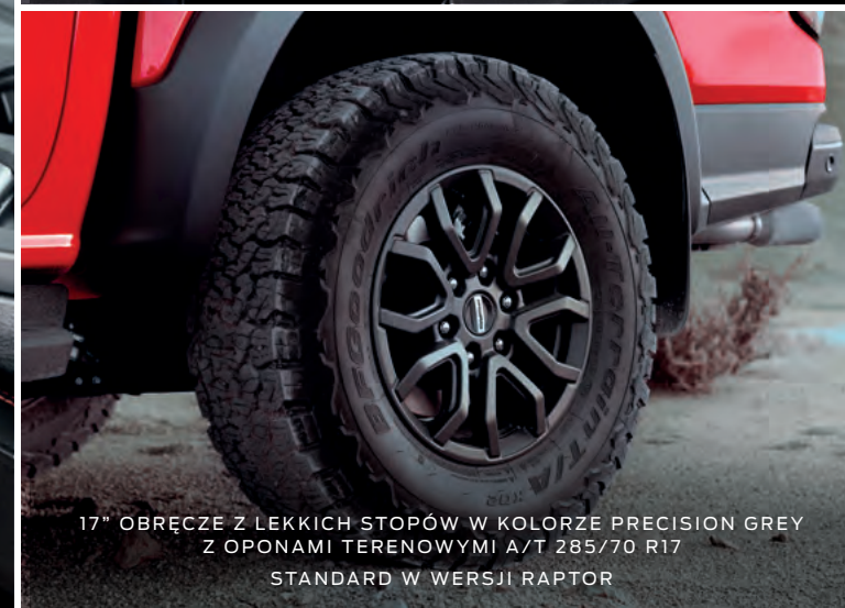
17" OBRĘCZE Z LEKKICH STOPÓW W KOLORZE PRECISION GREY Z OPONAMI TERENOWYMI A/T 285/70 R17 STANDARD W WERSJI RAPTOR